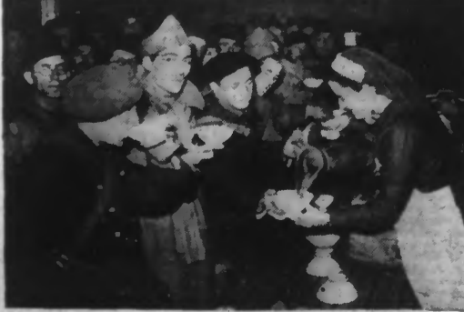
Une infirmière servant des sandwiches et du café chaud aux soldats permissionnaires. (Photo Keystone. — 38.265).