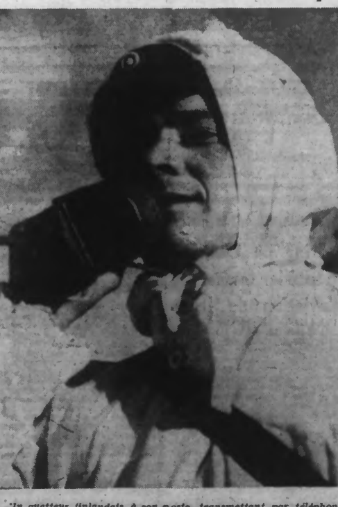
Un guerrier finlandais, à son poste, transmettant par téléphone, à ses chefs, ses observations concernant l'aviation russe. (Photo Keystone. — 38.175).

Elle craint une intervention éventuelle des Alliés et cherche à l'éviter à tout prix