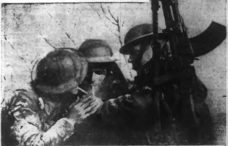
Consolider, devient de jour en jour plus forte.

Ce n'est que peu de temps avant la déclaration de guerre que la conscription fut décidée en GRANDE-BRETAGNE. Ainsi donc, en quatre mois, nos ALLIÉS ont levé une armée redoutable à tous les points de vue, une armée dont les éléments veillent aux côtés de nos « poilus » face à l'ennemi, ainsi qu'en témoigne le trio de tombées ci-dessous se donnant le « baptême du feu » d'une agréable façon. (Photo NYT. — A. 2452).