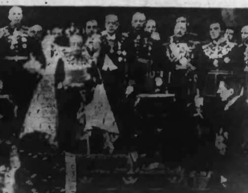
Le roi de Suède et son entourage, à l'ouverture du Parlement suédois, à Stockholm. (Photo Keystone. — 38.998).

Amsterdam, 14. — Depuis l'alerte très vive du début de novembre, la Hollande n'avait pas connu de menace aussi précise que celle qui se dessine de nouveau depuis quelques jours à la frontière germano-hollandaise. Le communiqué publié ce matin par l'Oberkommando des forces allemandes fait état d'une prétendue violation du territoire allemand par un avion hollandais au-dessus de Nordhorn. La Belgique d'abord, la Hollande ensuite, très vraisemblablement en accord complet, ont pris des mesures de précaution qui rappellent étrangement celles qui furent prises vers le 10 novembre. Bien que les milieux gouvernementaux hollandais se montrent très réservés et s'abstiennent de commenter la mesure qui a été prise aujourd'hui, ainsi que le communiqué de l'Oberkommando allemand, on note comme en novembre une inquiétude croissante dans la population particulièrement dans les provinces orientales du pays exposées à subir les premières attaques au cas où les dirigeants nazis passeraient de la menace à l'exécution. (Lire la suite en deuxième page)