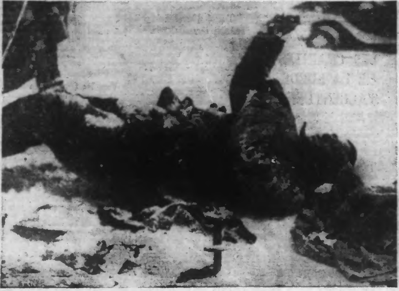
SOLDAT RUSSE TUE ALORS QU'IL MONTAIT UNE LIGNE TELEGRAPHIQUE (Photo N.Y. - 42.080).

Helsinki, 21. — La journée d'hier a été particulièrement agitée en Carélie. Plusieurs contre-attaques russes appuyées par de l'artillerie et des chars d'assaut ont été repoussées sans difficultés dans la même région. 350 avions russes ont bombardé des villes et des villages. Sept avions soviétiques ont été abattus. L'aviation finlandaise a pu mentionner à son actif quelques bombardements réussis qui atteignent l'arrivée d'un matériel efficace. Cinq avions russes mal protégés ont été détruits. A terre, sur le front du lac Ladoga, les combats se poursuivent.