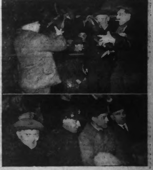
EN HAUT : Une présentation de coqs avant un combat. EN BAS : Dans l'assistance, on remarque deux amateurs militaires un « Tommy » et un « Poilu ». (Photo Réveil - A. A. 306).

roi de la basse-cour, a inauguré l'ère des combats de coqs