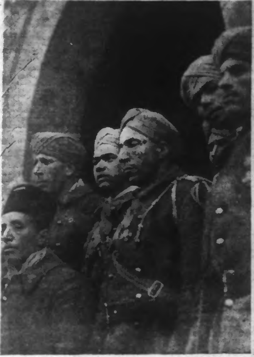
Ces vaillants soldats de notre EMPIRE sont des Marocains dont la conduite au front leur a valu, pour la plupart, le port de la nouvelle Croix de Guerre. Patient et tenace, ils jouent le plus souvent le rôle de « guetteurs » aux avant-postes. (Photo Keystone - 42.433).

Des Marocains sans cesse aux aguets Ils étaient dans cette vallée depuis une douzaine de jours, on coin dans les lignes ennemies, menacés à chaque instant par les patrouilles, à la merci des coups de main, si l'on ose dire. Des Marocains... c'est-à-dire les hommes les plus aptes à la lutte d'aujourd'hui : patients à l'extrême, capables de rester immobiles par je ne sais combien de degrés au-dessous de zéro, pendant des heures, pour observer les mouvements de l'ennemi, obéissant aveuglément aux ordres de leurs chefs, braves entre les plus braves, les hommes-typés de la guerre d'embuscade et de patrouille telle qu'on la mène à présent. D'autres Marocains venaient les remplacer. Sur la route de ce village perdu à l'extrême limite des avant-postes, nous avions rencontré un de nos plus aimables confrères, le lieutenant O., terre dans une tour.