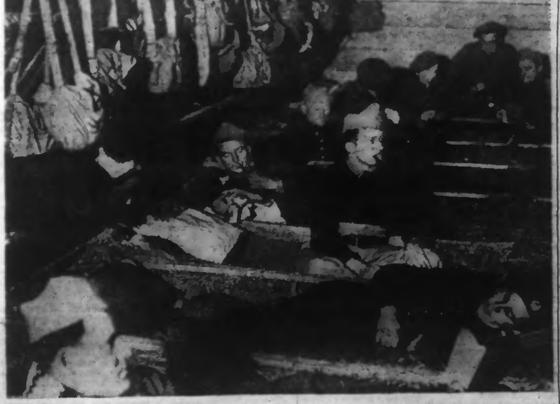
DANS UNE GRANGE, AU CANTONNEMENT, LES « POILUS » SE REPOSENT. (Photo Keystone - 41.964).

Néanmoins, les nazis ont déclenché une attaque d'une certaine importance, mais que nos vaillants « poilus » repoussèrent brillamment, non sans avoir fait des prisonniers