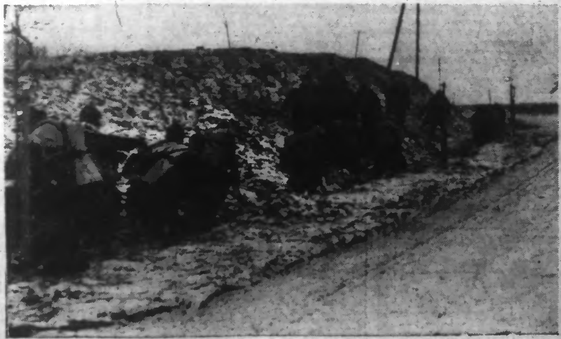
UNE PATROUILLE SUR UNE ROUTE CONTOURNANT UNE CRÊTE.

Du Rhin à la Moselle on signale des rencontres entre patrouilles, des embuscades et des tirs d'artillerie