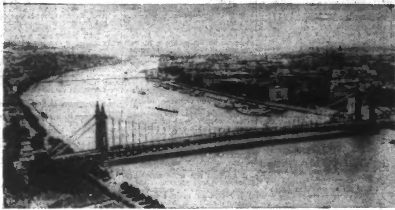
UNE VUE GÉNÉRALE DU DANUBE A BUDAPEST.

LONDRES, 30 AVRIL. — A peine arrivé à Londres, je me remémore mon voyage au pays des soupis, sur ces rives du Danube d'où en moins d'une heure je me serais trouvé à même avec une voiture silencieuse et rapide, à franchir la frontière de la Hongrie. La file des chalands qui remontent le fleuve sous mes yeux y déchargent sa cargaison dans la journée