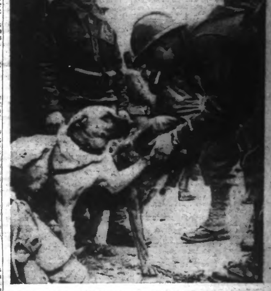
Soldats du corps expéditionnaire français avec leurs chiens sanitaires. (Photo Nyl. — 83.202.)