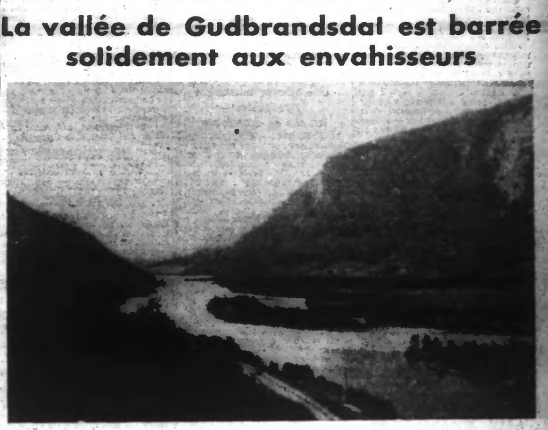
Un aspect de la VALLEE DU GUDBRANDSDAL, barrée par les forces britanniques et norvégiennes.

Paris, 30. — La bataille en Norvège est encore et surtout une bataille d'aviation. L'importance de l'arme aérienne présentée par tous les théoriciens militaires depuis les quinze dernières années, se trouve actuellement confirmée en Norvège comme elle l'avait déjà été en Pologne.