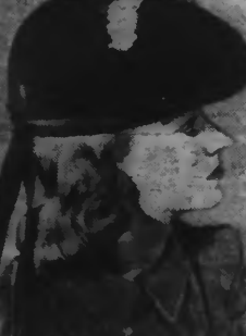
Le jeune marin est bordé d'un gros grain de même ton et porte un pompon de voile rouge et blanc.