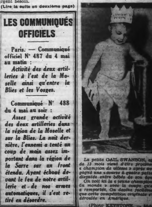
La petite GAIL SWANSON, âgée de 13 mois vient d'être proclamée championne du monde à quatre patins à roues alignées.