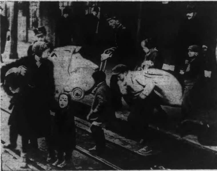
Tous les Norvégiens qui ont eu la possibilité de fuir devant les envahisseurs nazis, se sont réfugiés en Suède ; notre photo montre des familles norvégiennes et de jeunes réfugiés en gare suédoise.

La France et la Grande-Bretagne, dont les forces se regroupent en Norvège du Nord, s'apprentent à poursuivre les opérations avec la plus grande vigueur