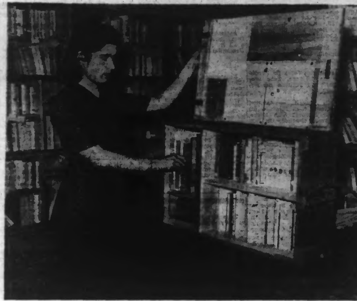
Au « Secours National » des classes sont entassées pour être garnies de livres d'histoire, d'aventures, de science, d'images d'Épinal et de mots croisés, qui sont destinés aux évacués Alsaciens-Lorrains. (Photo N.Y.T. — 60.541.)