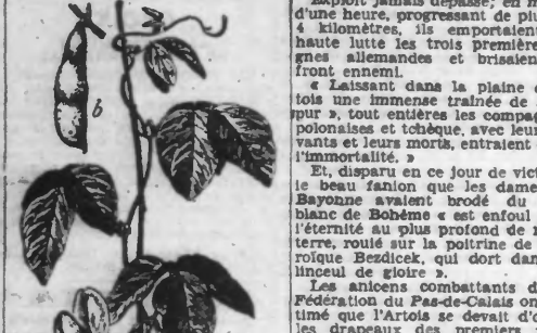
Soya : a, fleur ; b, fruit.

Toutes les denrées sont rationnées en Allemagne. Des restrictions sévères en ce qui concerne la consommation de la viande, du beurre, des pâtes alimentaires, etc., furent imposées à la population civile dès le premier jour de la guerre. L'alimentation des armées allemandes pose des problèmes difficiles, parce que l'Etat-Major ignore pas que la répétition des fautes commises pendant la guerre mondiale de 1914-18, quand l'alimentation des troupes était mauvaise et insuffisante, pourrait entraîner de graves conséquences lourdes. Dans les laboratoires, attachés à l'intendance