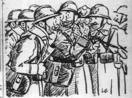
Il tenait serré dans ses doigts de singe le fin papier bléuté.