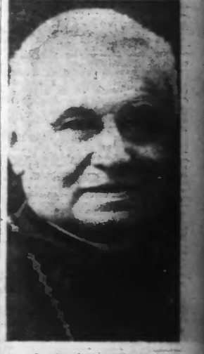
Le Cardinal SUHARD le nouvel Archevêque de PARIS.

Cité du Vatican, 11. — Le nouvel archevêque de Paris a été nommé par le Pape en la personne du cardinal Suhard, actuellement archevêque de Reims.