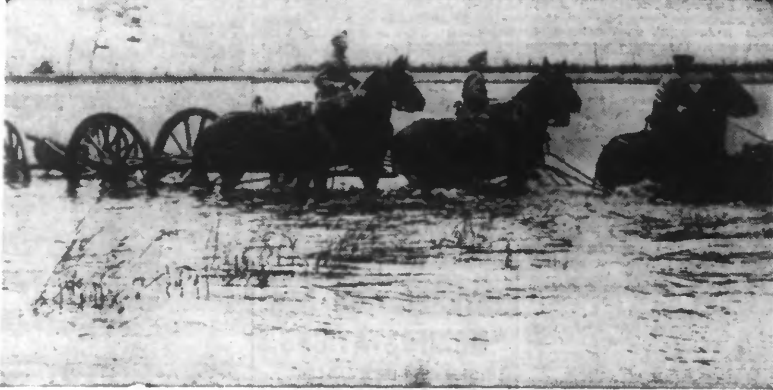
UN ASPECT DES INONDATIONS DU TERRITOIRE HOLLANDAIS. (Photo Nyl. — 86.991).

L'AVIATION FRANÇAISE A BOMBARDÉ DE NOMBREUX AÉRODROMES ALLEMANDS