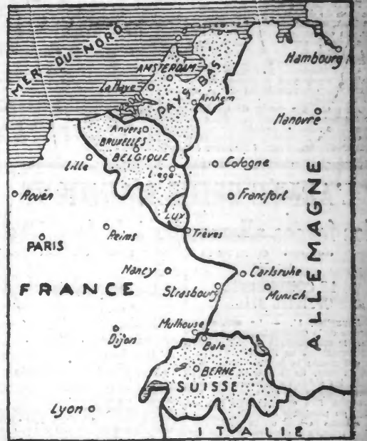
(A. A. 1.133)