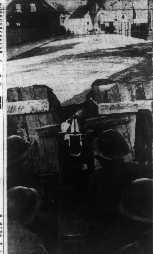
Un petit poste de soldats hollandais défendant une route importante.

« Selon le « Daily Mail », les divisions motorisées allemandes, marchant en ligne défensive à la frontière belgo-hollandaise, ont capturé les villes de Arnhem et de Maastricht en Hollande, ont passé la Meuse et se fraient un chemin en combattant dans une terrible poussée vers le Canal Albert. » « On nous assure officiellement que la capture d'Arnhem n'est pas d'une importance stratégique considérable. » « La ville, qui compte 50.000 habitants, est toute proche de la ligne fortifiée sur laquelle les Hollandais se sont repliés dès le début de l'invasion. » « Elle se trouve sur le Rhin, juste au nord du point où le fleuve se joint à l'Yssel. » « Quant à la prise de Maastricht, elle ouvre un chemin aux Allemands