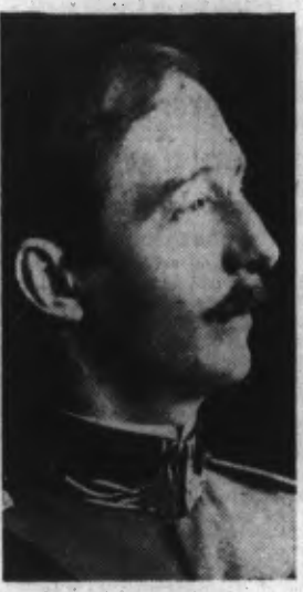
L'ex-roi ZOGU d'Albanie

Amsterdam, 31. — Le « Daily Sketch » annonce que l'ex-roi Zog d'Albanie, aurait l'intention de quitter l'Angleterre avec sa famille et sa suite pour se rendre aux Etats-Unis. A cet effet, il voudrait acquérir un yacht privé. Le journal de-