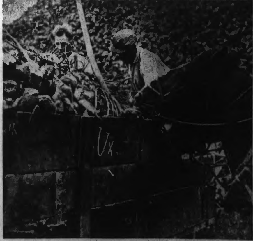
Un chargement de récolte de betteraves sucrières dans le Nord

LA RÉCOLTE S'ANNONCE DE QUALITÉ EXCELLENTE