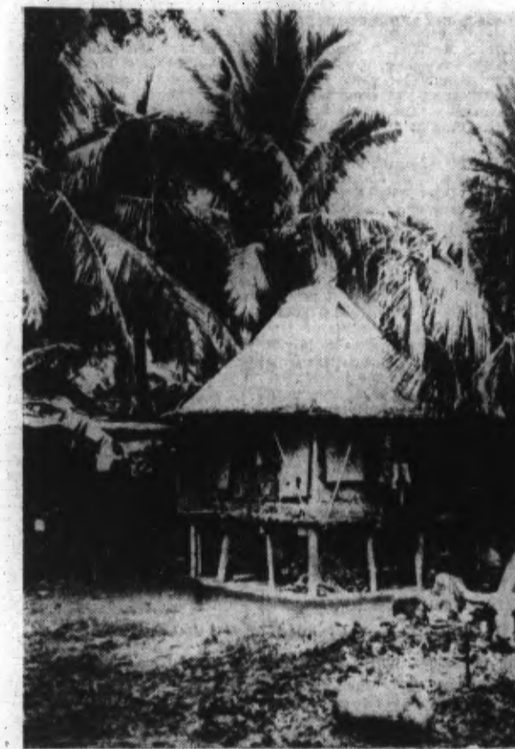
Une hutte d'indigènes dans une des îles Philippines.

Soupons japonais « A tout prendre, l'élection présidentielle aux Etats-Unis n'a pas été considérée par l'opinion publique japonaise comme un événement décisif de la politique extérieure. On n'a pu découvrir, au Japon, entre la position des démocrates et celle des républicains, vis-à-vis des questions de l'Extrême-Orient, que des différences microscopiques. C'est ainsi que la période électorale n'a été considérée, au Japon, que comme une possibilité de voir, mise un peu à l'arrière-plan, la politique des Etats-Unis à l'égard du Japon. »