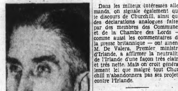
M. VON PAPAN, Ambassadeur du Reich à ANKARA