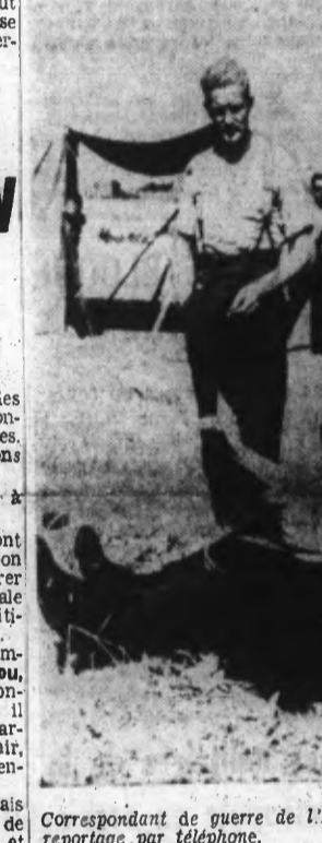
Correspondant de guerre de l'Armée de l'Air transmettant son rapportage par téléphone.

Stockholm, 13. — Le communiqué du ministère britannique de l'Air, publié mercredi matin, annonce qu'au cours de la nuit de mardi