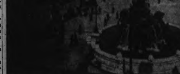
La Place de Terreaux, où les membres de la Légion Française des Combattants, prêteront serment au-Chef de l'Etat français.