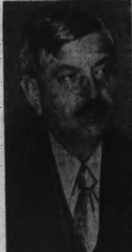
M. Pierre LAVAL. L'ambassadeur d'Espagne à Paris communique :

« M. Pierre Laval, vice-président du Conseil, a eu hier un long entretien à l'ambassade d'Espagne avec M. Serrano Suner, ministre des Affaires étrangères d'Espagne, de passage à Paris en route pour Berlin. »