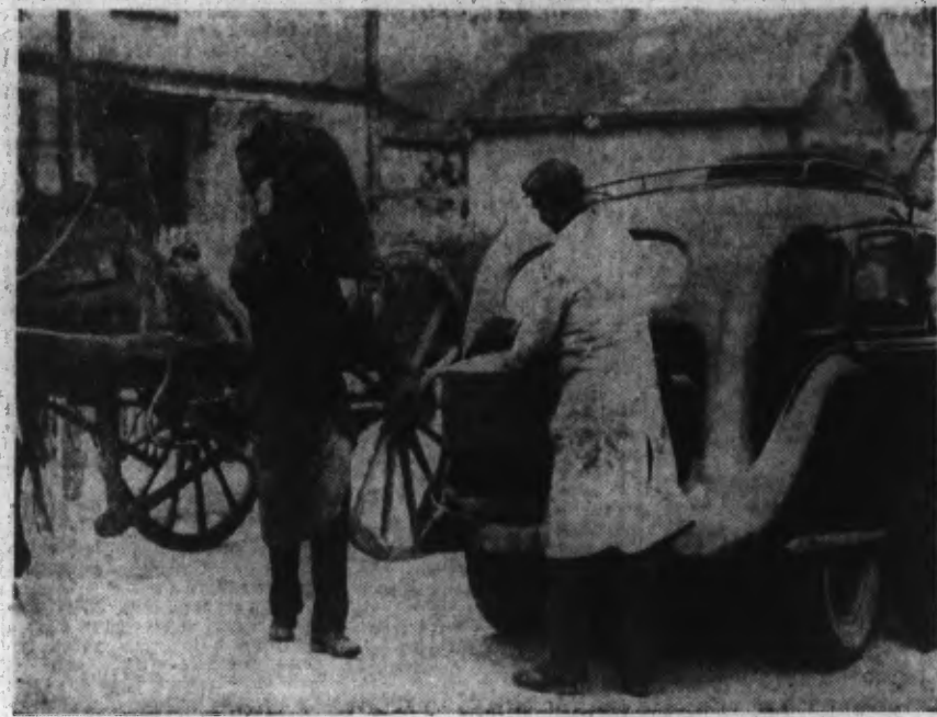
Ce taxi marche au gazogène fourni par anthracite ou même bois vert. L'économie réalisée est de 70 % et la vitesse de la voiture est diminuée seulement de 15 %. Tout l'appareillage de gazogène se trouve logé dans le coffre arrière et une charge de 175 kilos de charbon permet de parcourir 700 kilom.

La pénurie d'essence contraint aux transformations qui mettent au premier plan les générateurs à gaz de bois et les autos électriques