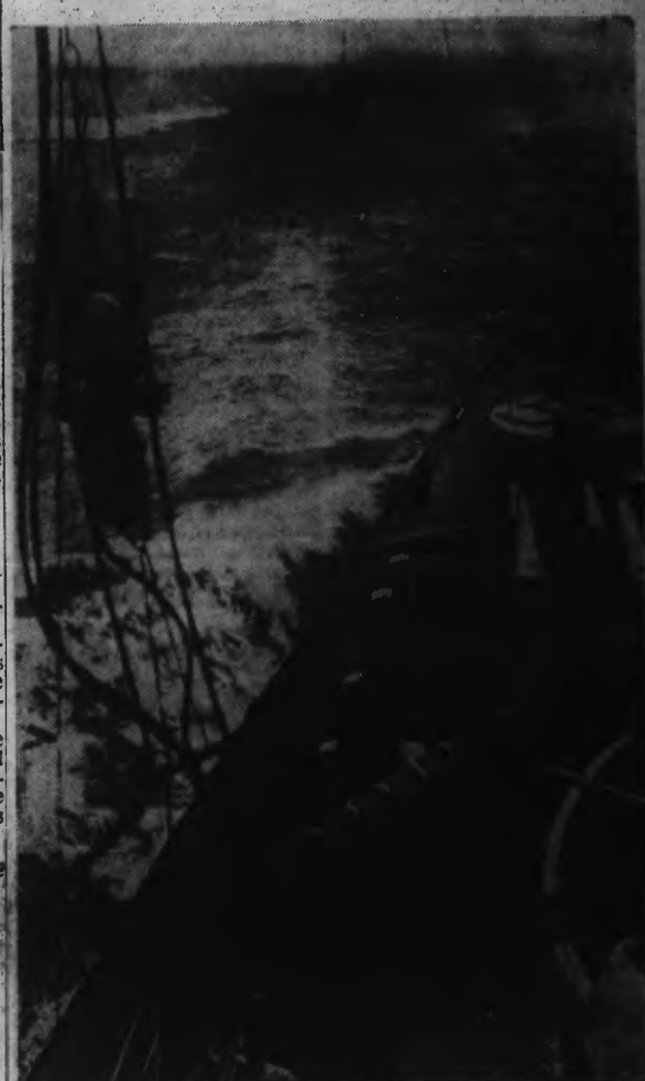
UN BÂTEAU DE GUERRE ALLEMAND RENTRE AU PORT

UN GIGANTESQUE INCENDIE A ÉTÉ ALLUMÉ DANS LE PORT DE SOUTHAMPTON