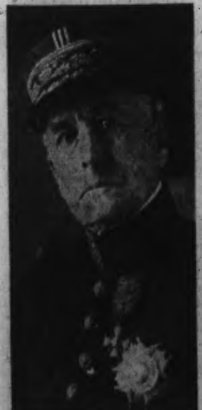
Le général BRECARD