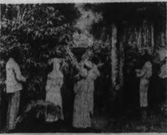
LA RECOLTE DU CAFÉ.

Les répercussions sur le plan politique d'un problème délicat