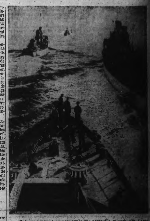
Bateaux entrant au port après une patrouille en mer.

CLIQUE EN DEUXIEME PAGE : LE COMMUNIQUÉ ITALIEN.