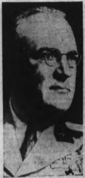
...Sous-Chef de l'Etat-Major de l'armée italienne, qui commande actuellement les troupes transalpines sur le front grec.