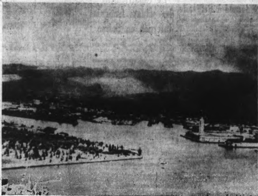
LA BASE AERIEENNE D'HONOLULU

L'archipel veut devenir État Fédéral américain bien qu'un tiers de sa population soit japonaise