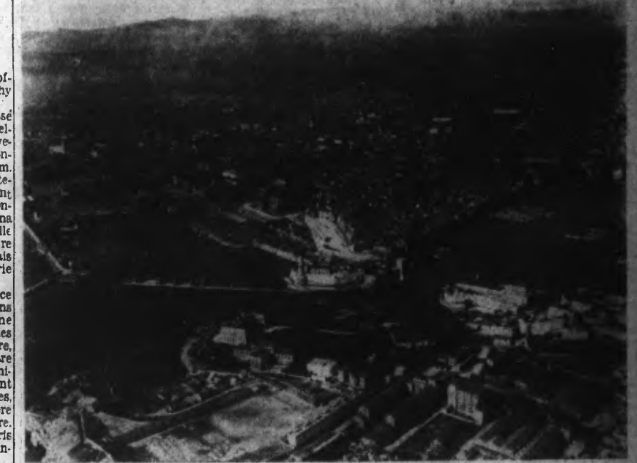
VUE AERIEENNE DU PORT DE MARSEILLE

AUPARAVANT IL AVAIT REÇU LE SERMENT DES LÉGIONNAIRES ET ASSISTÉ AU DÉFILÉ DES TROUPES