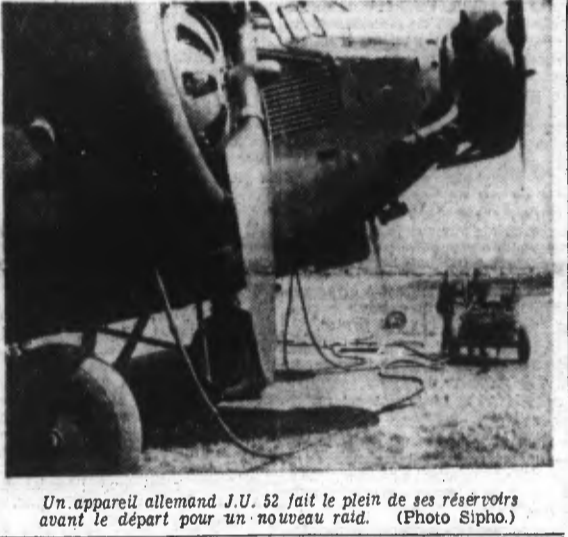
Un appareil allemand J.U. 52 fait le plein de ses réservoirs avant le départ pour un nouveau raid.

Berlin, 7. — Dans un éditorial sous le titre « Bombes, blocus, représailles, la guerre que l'Angleterre a voulue », l'hebdomadaire « Das Reich » écrit entre autres : « Le Führer a fait des propositions pour la conduite humaine de la guerre et les a continuellement répétées. » (Lire la suite en deuxième page)