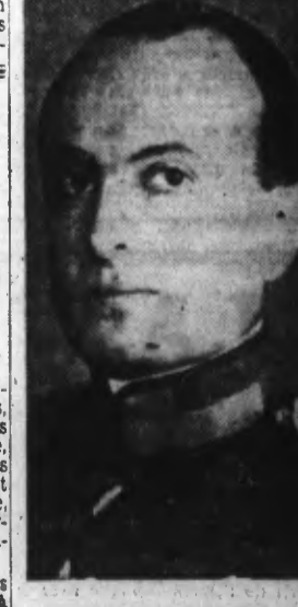
Le Prince PAUL de YOUGO-SLAVIE

Vichy, 7. — La Radio britannique a déclaré, ces jours derniers, qu'un certain nombre de jeunes gens dont on fixe le nombre à onze, auraient été condamnés par des conseils de guerre allemands et passés par les armes. Il en résulte, dans des milieux trompés par certaine propagande, une émotion naturelle. Les faits sont les suivants : Lors de incidents du 11 novembre, à Paris, il a été procédé à l'arrestation de quelques lycéens et étudiants. Quatre personnes ont été légèrement blessées, aucune n'a été tuée. Les autorités allemandes n'ont envoyé devant les tribunaux ni un étudiant ni un lycéen. A plus forte raison, il n'a été procédé à aucune exécution capitale. Les informations des émigrés qui osent parler devant le micro britannique sont donc des fausses nouvelles.