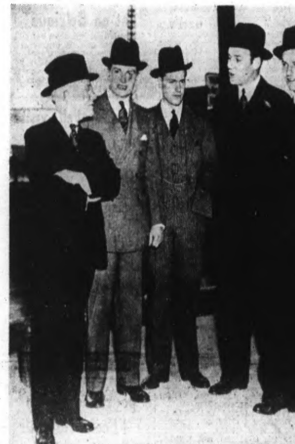
La famille ROCKEFELLER ; on voit de gauche à droite : John D. ROCKEFELLER Junior, fils et successeur du Roi du Pétrole, et ses fils David, Nelson, Winthrop, Lawrence et John D.

Examinant la situation financière des ETATS-UNIS, la « Frankfurter Zeitung » écrit : Contre la concentration capitaliste « On a répandu à l'étranger, comme en AMERIQUE même, de fausses statistiques sur la répartition de la possession d'actions aux ETATS-UNIS.