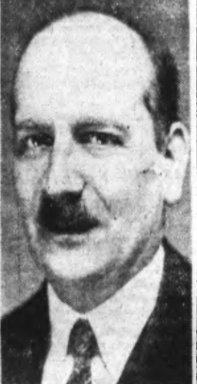
M. P.-E. FLANDIN qui deviendrait Ministre de l'Intérieur.

Berlin, 7. — Le bruit court à Vichy que des modifications interviendraient prochainement dans le gouvernement français.