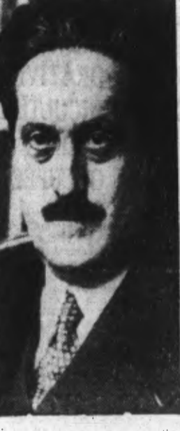
M. Pierre CATHALA

Vichy, 7. — Le Conseil des ministres s'est réuni cet après-midi sous la présidence du maréchal Pétain. Le président Laval a fait l'exposé des questions diverses discutées la veille au cours du Conseil de Cabinet. Il a rappelé que dans les pays qui avaient tenté les premiers de créer la corporation, de longs besoins d'un crédit de 2,7 milliards de dollars.