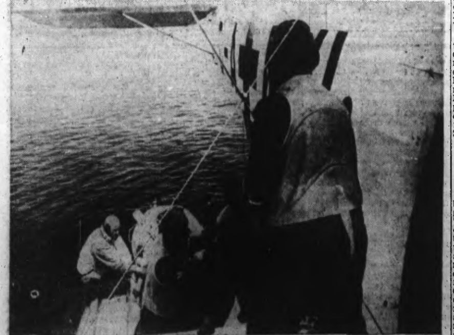
Avion sanitaire maritime prenant à bord des aviateurs occidentaux en mer.