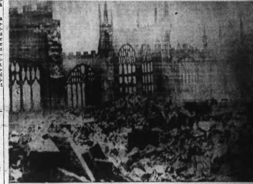
Dans un centre industriel de guerre à COVENTRY, une cathédrale complètement détruite par les bombes.