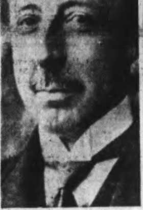
M. Léon BÉRARD, Ambassadeur de France près le Saint-Siège.