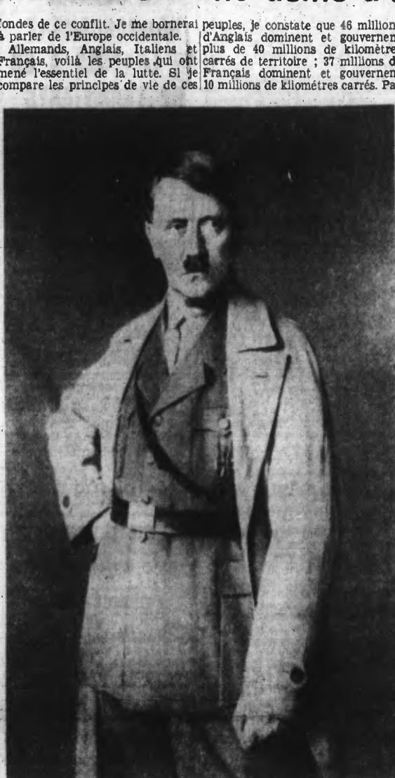
Le Chancelier Adolf HITLER.

On apprend, d'autre part, de Rome qu'un décret vient de décerner à titre posthume la médaille d'Or de la valeur militaire au maréchal de l'Air Italo Balbo.