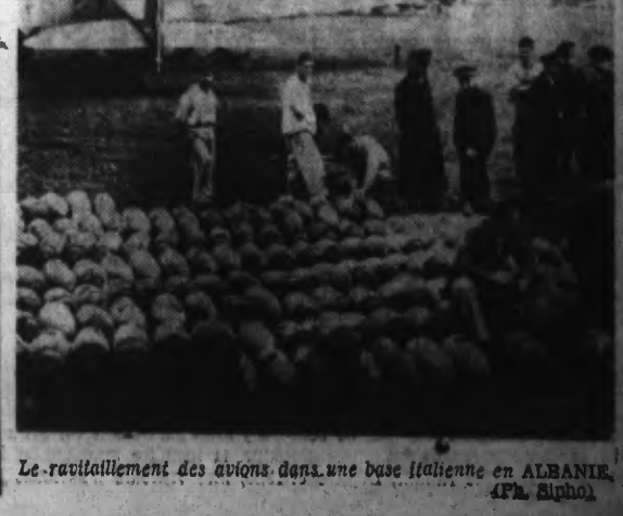
Le ravitaillement des avions dans une base italienne en ALBANIE.