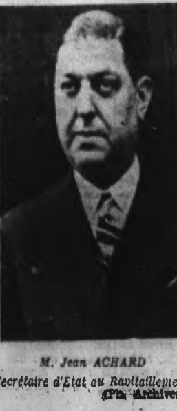
M. Jean ACHARD Secrétaire d'Etat au Ravitaillement.

Vichy, 10. — M. Jean Achard, secrétaire d'Etat au ravitaillement, a présidé cet après-midi à la Chambre de Commerce de Toulouse, une réunion agricole d'information organisée par la Fédération des Syndicats corporatistes paysans du Massif Central et du Sud-Ouest.