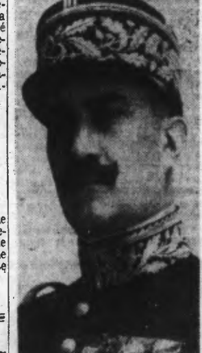
Le Général DENTZ

Vichy, 10. — Les informations reçues d'Ankara annoncent que les milieux politiques turcs ont accueilli favorablement la nouvelle de la nomination du général Dentz en Syrie. Avant tout désireux de voir l'ordre maintenu en Syrie, les Turcs ne tiennent pas à voir la Syrie passer sous un autre contrôle. La désignation d'un militaire ayant un passé tel que celui du général Dentz les rassure et leur inspire confiance.