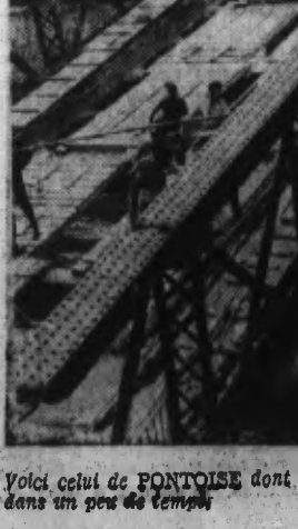
Voici celui de PONTAISE dont la remise en service est escomptée dans un peu de temps.