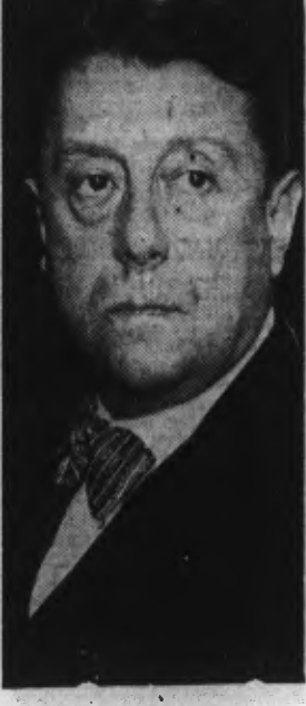
M. PEYROUTON secrétaire d'Etat à l'Intérieur.

Vichy, 12. — Sous l'ancien régime, la politique avait tout dénaturé dans les mairies comme ailleurs, surtout dans les villes, il s'agit moins souvent d'éduquer que de discuter les questions de politique extérieure ou intérieure. La Mairie était devenue un tremplin pour beaucoup d'entre eux qui rêvaient de conquérir le pouvoir ; la première tâche du gouvernement du Maréchal Pétain a été de lutter contre les agissements envahissants de la politique partisane et M. PEYROUTON, ministre secrétaire d'Etat à l'Intérieur, recevant hier la Presse, a qualifié de symbolique la réforme de l'administration municipale dont le gouvernement vient de jeter les bases. Cette réforme a pour objet essentiel de rendre leur caractère éditorial aux conseils municipaux, et de s'élever contre la féodalité des mandats superposés. Dans la loi parue dès ce matin au J. O., il est interdit en propres termes que lorsque les membres d'une Assemblée Nationale seront constitués, les maires ne pourront en faire partie. « Le mode de désignation des conseils municipaux des communes rurales ne diffère guère de celui en vigueur jusqu'ici ; il convient de remarquer que les communes rurales, c'est-à-dire celles qui comptent moins de 2.000 habitants, sont en France au nombre de 35.292, alors qu'il n'y a dans l'ensemble du territoire que 2.722 communes urbaines. Le principe de l'élection reste ainsi entier pour les 14/15 es des communes de France. (Lire la suite en deuxième page)