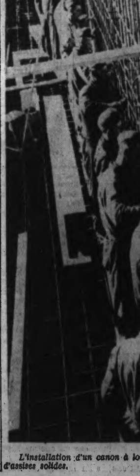
L'installation d'un canon à longue portée nécessite la construction d'assises solides.