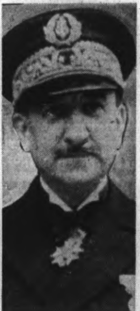
Le vice-amiral DECOUX gouverneur général de l'Indochine.

Des éléments communistes s'étaient livrés à certains excès d'ailleurs considérablement exagérés