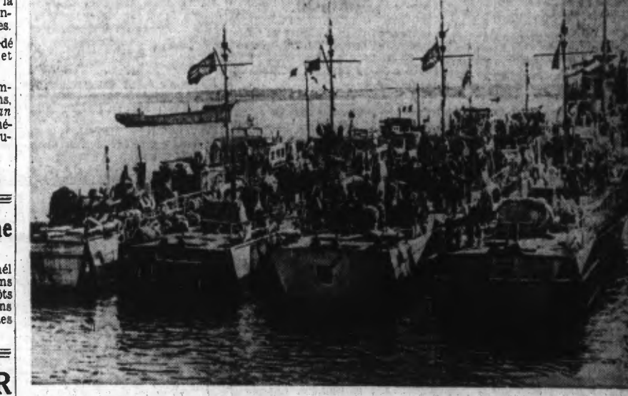
Une flottille de vedettes rapides s'est mise à l'ancre dans un port de la côte.