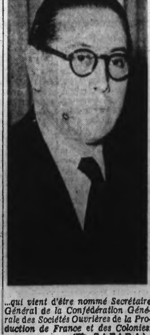
...qui vient d'être nommé Secrétaire Général de la Confédération Générale des Sociétés Ouvrières de la Production de France et des Colonies.