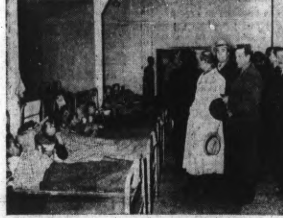
Des journalistes étrangers ont visité un camp de prisonniers français en ALLEMAGNE. Les voici pendant leur passage à l'intérieur.