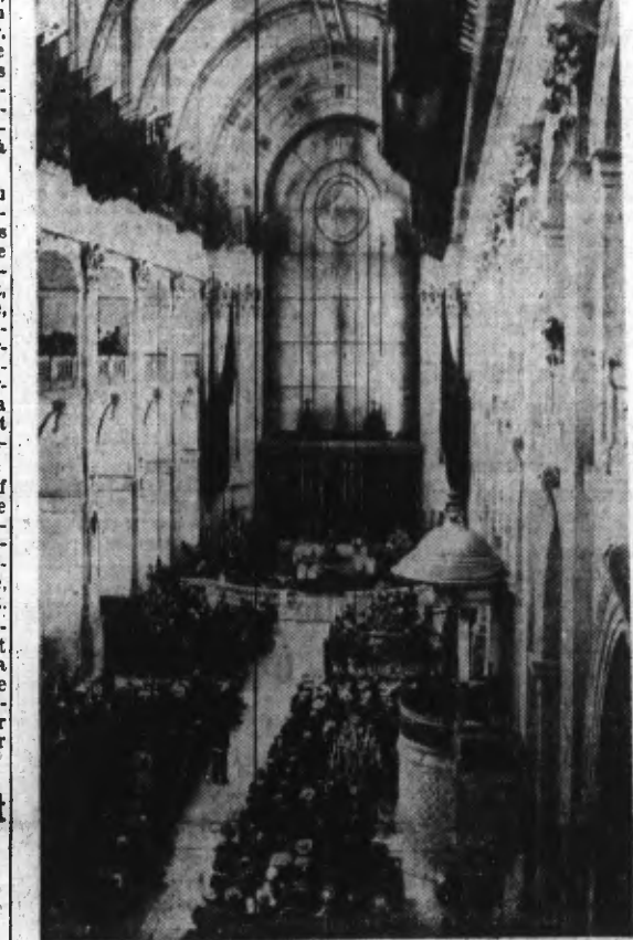
La Chapelle Saint-Louis des Invalides.

Après, la bière était placée sur un prolonge d'artillerie et, à minuit, ce spectacle était grandiose. Précédé par des Gardes Républicains, le cortège arriva devant l'Hôtel des Invalides rendus, la dépouille mortelle, où l'attendaient les personnes