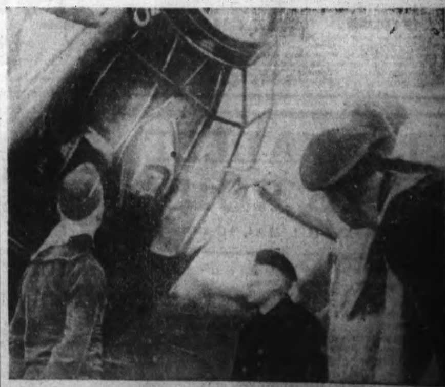
Un pilote aviateur donne toutes explications à des marins sur la manœuvre de l'appareil.