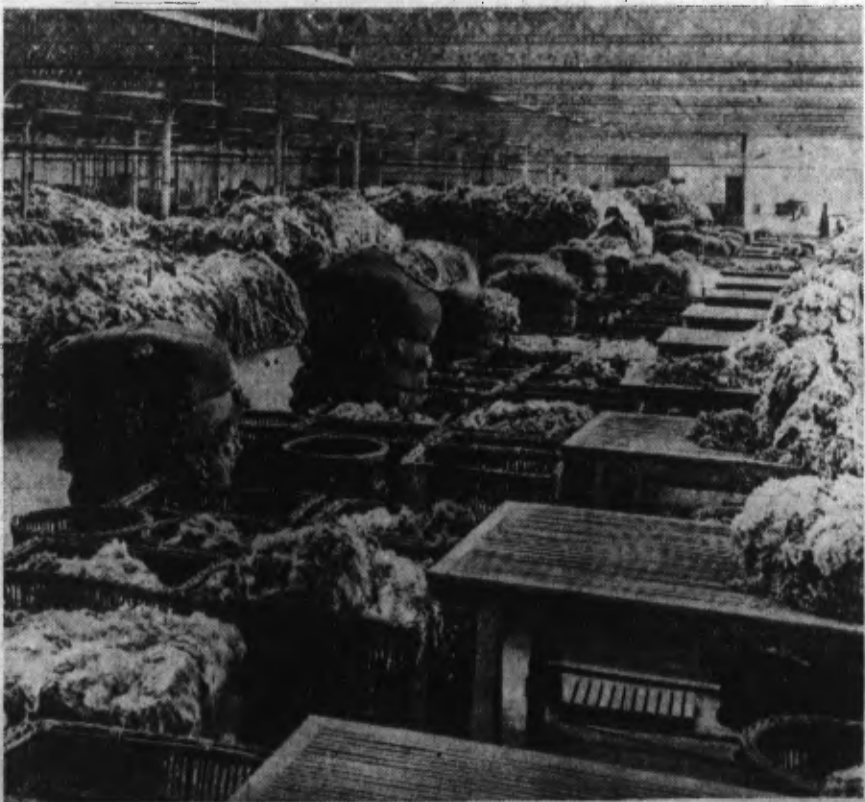
Un immense magasin de laine de TOURCOING.

TANT DANS LES MINES, QUE DANS L'INDUSTRIE TEXTILE ET L'AGRICULTURE, L'ACTIVITÉ BAT MAINTENANT SON PLEIN