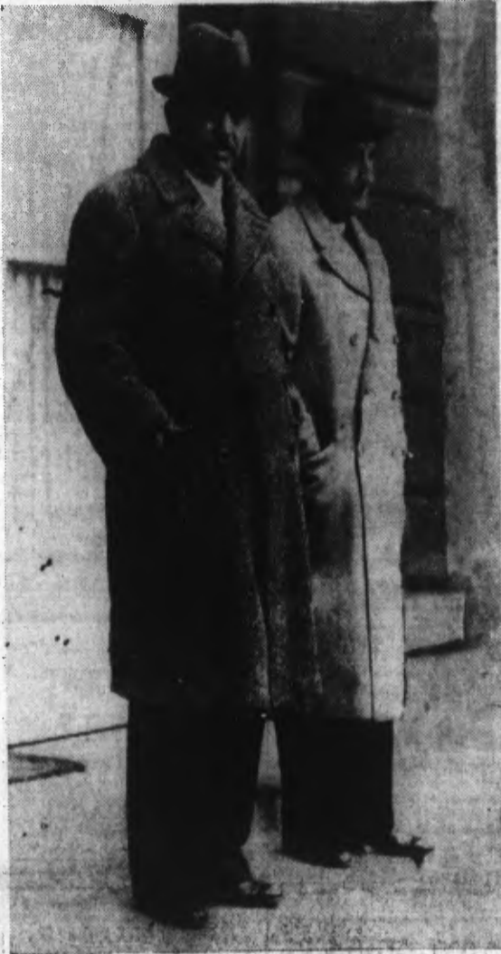
M. Pierre LAVAL en compagnie de M. DE BRINON, Ambassadeur.

Hier soir, au début de l'émission de 21 h. 45, le « Journal de la Radiodiffusion française » a diffusé l'information suivante :