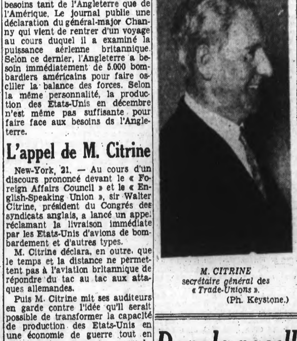
M. CITRINE secrétaire général des « Trade-Union »