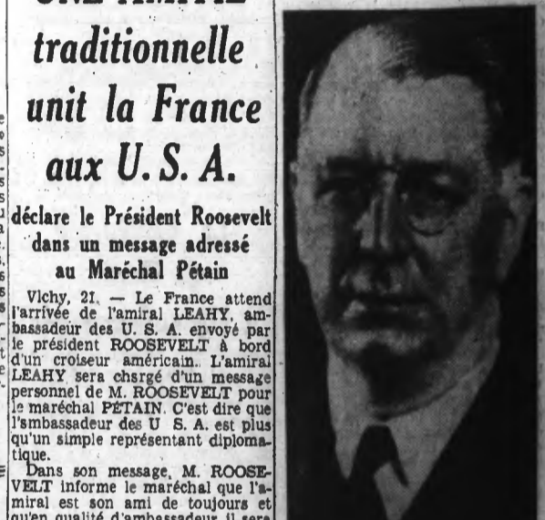
M. KNOX ministre américain de la Marine.

lignes italiennes, les plus avancées au sud-est de Sidi Barrani.