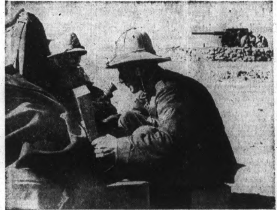
UNE BATTERIE ITALIENNE SUR LE FRONT DE L'AFRIQUE DU NORD.