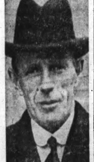
Lord HALIFAX.

Qui sera ambassadeur de Grande-Bretagne à Washington ? La presse américaine continue à émettre quotidiennement des pronostics à propos de la succession de lord Lothian. Le nom du duc de Windsor a été déjà favorablement envisagé par l'opinion, et l'on sait que le duc lui-même, tout en déclarant qu'il n'était pas candidat à ce poste, a ajouté qu'il se tenait à la disposition de son pays.