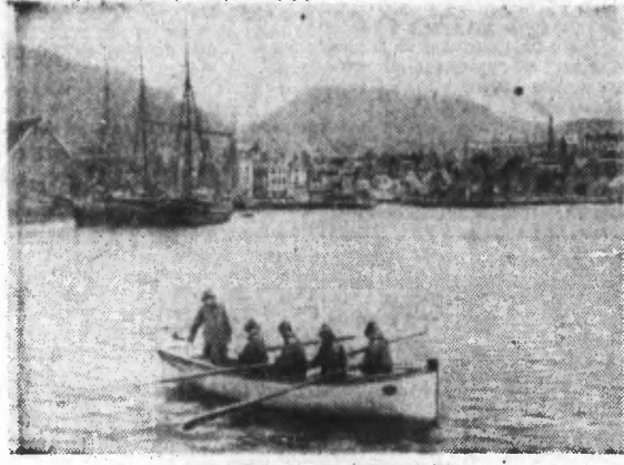
UNE VUE DU PORT DE BERGEN

GRACE A CE COURANT CHAUD, IL FAIT MOINS FROID EN JANVIER A BERGEN, EN NORVÈGE, QU'À VIENNE