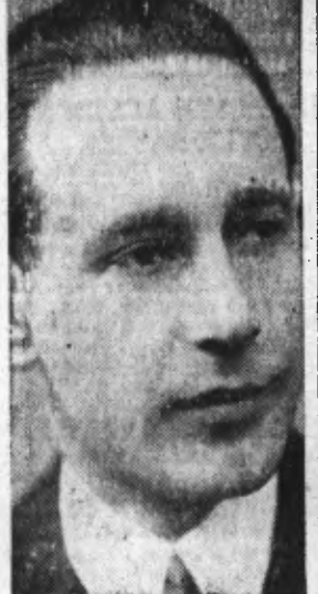
M. BOROTRA, Sous-Secrétaire d'Etat à l'Éducation Physique et aux Sports

Vichy, 29. — Dans le courant du mois de janvier, la doctrine nationale d'éducation générale et sportive sera publiée. Elle traitera de l'éducation physique et de la gymnastique corrective, de l'initiation