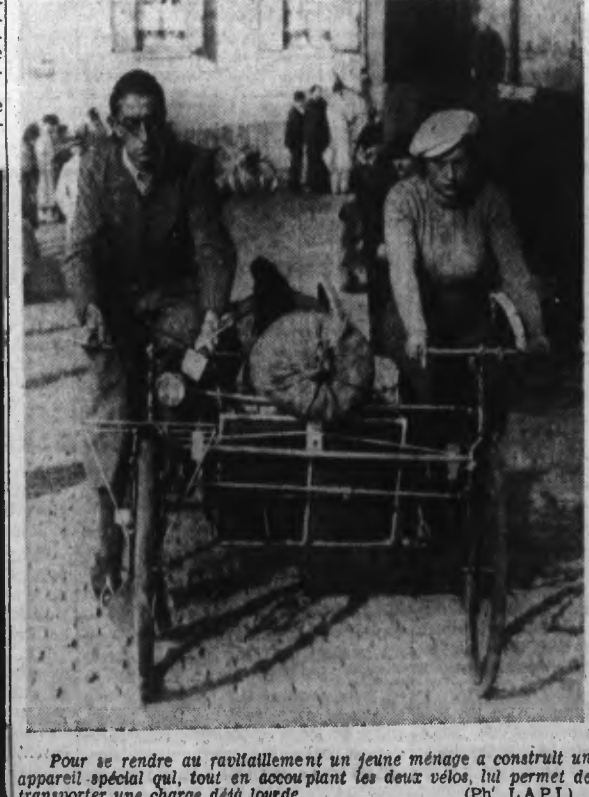
Pour se rendre au ravitaillement un jeune ménage a construit un appareil spécial qui, tout en décollant les deux vélos, lui permet de transporter une charge déjà lourde.