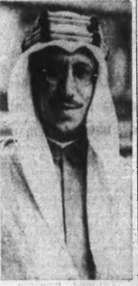
Le roi Ibn SAOUD

Milan, 28. — La « Stampa » de Turin mande de Beyrouth que la police vient de découvrir un complot dirigé contre le gouvernement du roi Ibn Saoud d'Arabie. Mandaté par son gouvernement, le consul général de l'Etat arabe d'Ibn Saoud, à Damas, a fait à ce sujet une déclaration.