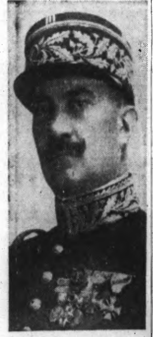
Le général DENTZ.

Beyrouth, 29. — Le général Dentz, le nouveau commissaire français pour la Syrie et le Liban, est arrivé dans sa résidence, où il a pris aussitôt la direction de son poste.