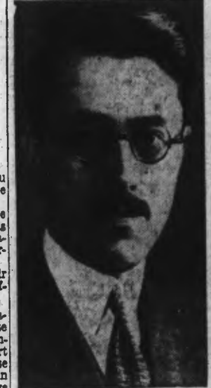
M. BOUTHILLIER, ministre des Finances.

De nombreux anciens parlementaires sont arrivés à Vichy, dans l'espoir que le gouvernement aura peut-être bientôt besoin de leur concours.