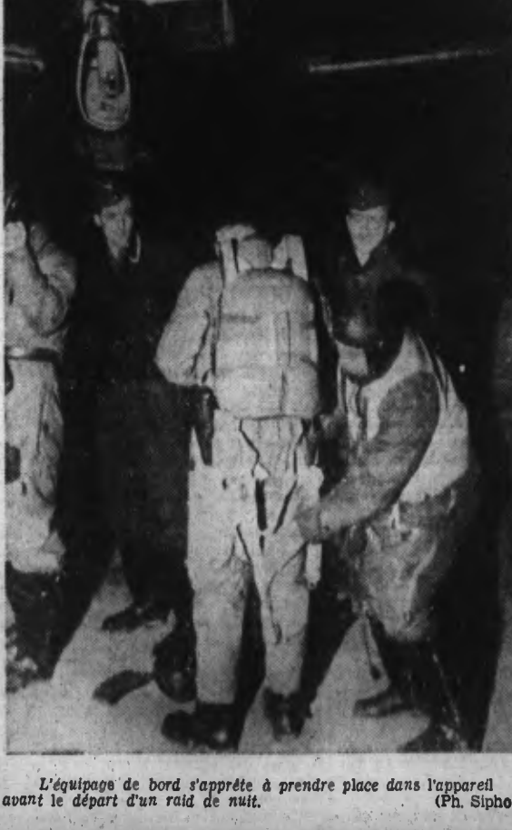
L'équipage de bord s'apprête à prendre place dans l'appareil avant le départ d'un raid de nuit.