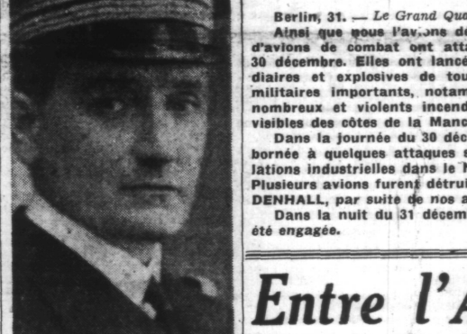
Le Contre-Amiral PLATON

Vichy, 31. — Le contre-amiral Platon, secrétaire d'Etat aux Colonies, vient de recevoir, à l'occasion de la nouvelle année, des différents coins de l'Empire, des télégrammes manifestant au chef de l'Etat et au Gouvernement le loyalisme des populations françaises et indigènes.