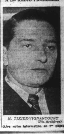
M. TIXIER-VIGNANCOURT

Berlin, 31. — Le Grand Quartier Général allemand communique : Ainsi que nous l'avons déjà annoncé, de fortes formations d'avions de combat ont attaqué LONDRES dans la nuit du 30 décembre. Elles ont lancé des quantités de bombes incendiaires et explosives de tous les calibres, sur des objectifs militaires importants, notamment au centre de la ville. De nombreux et violents incendies se sont déclarés, qui étaient visibles des côtes de la Manche. Dans la journée du 30 décembre, l'activité de l'aviation s'est bornée à quelques attaques sur des aérodromes et des installations industrielles dans le Nordfolk et le Cambridgeshire. Plusieurs avions furent détruits au sol sur l'aérodrome de MILDENHALL, par suite de nos attaques effectuées en rase-motte. Dans la nuit du 31 décembre, aucune action de combat n'a été engagée.