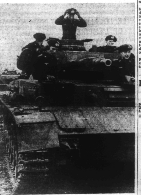
L'équipage d'un char de combat a pris place à son poste.

« La guerre sera menée jusqu'à ses dernières conséquences »