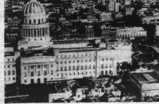
Une vue aérienne de LA HAVANE, capitale de l'île de Cuba.

Très inquiets sur l'avenir de l'économie mondiale, les Etats-Unis tournent leurs regards vers l'Allemagne