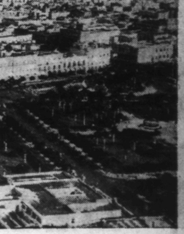
Une vue aérienne de LA HAVANE, capitale de l'île de Cuba.

Très inquiets sur l'avenir de l'économie mondiale, les Etats-Unis tournent leurs regards vers l'Allemagne