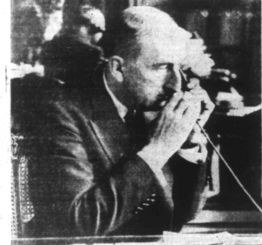
M. DE BRINON, délégué général au Gouvernement français auprès des autorités allemandes.

Pas plus qu'un automobiliste vous n'avez le droit d'être distraits en conduisant votre machine. Vous devez veiller à garder rigoureusement votre droite ; Ralentir aux carrefours et redoubler d'attention ; Lever le bras droit si vous voulez tourner à droite ; le bras gauche si vous voulez tourner à gauche. NE JAMAIS ROULER A DEUX OU TROIS DE FRONT. Être toujours maître de votre machine. Enfin, vous devez vous rappeler que faire de la bicyclette n'est pas un jeu de cirque et, que les cyclistes surpris roulant les deux mains dans les poches sont désormais sévèrement punis.