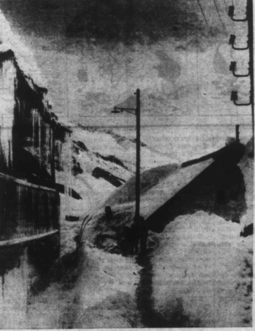
La neige s'étend partout dans les montagnes comme sur la plaine. Si les communications ne sont pas interrompues elles sont parfois fort difficiles.