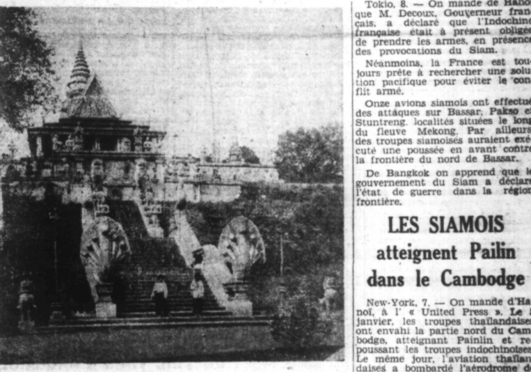
La grande pagode PNOM-PENH, au Cambodge.

Néanmoins la France est toujours prête à rechercher une solution pacifique