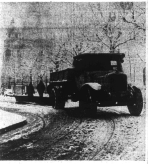
Devant l'Hôtel du Parc, siège du Gouvernement français, un chasseur-neige dégage la chaussée.

Les personnes qui ne sont pas encore en correspondance avec l'agence centrale des prisonniers de guerre à Genève, ou dont les demandes sont antérieures au 1 er septembre 1940 devront les renouveler sur carte formulaire 275 bis ou sur carte postale, en spécifiant bien les nom, prénoms, date de naissance, arme, régiment, lieu et date de disparition du militaire, dont elles sont sans nouvelles.