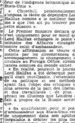
Lord HALIFAX

« Ce qui est caractéristique pour la situation qui a provoqué l'envoi de cet homme aux Etats-Unis, c'est la phrase de Churchill : « Notre plus vit espoir est qu'Halifax réussisse dans sa mission ».