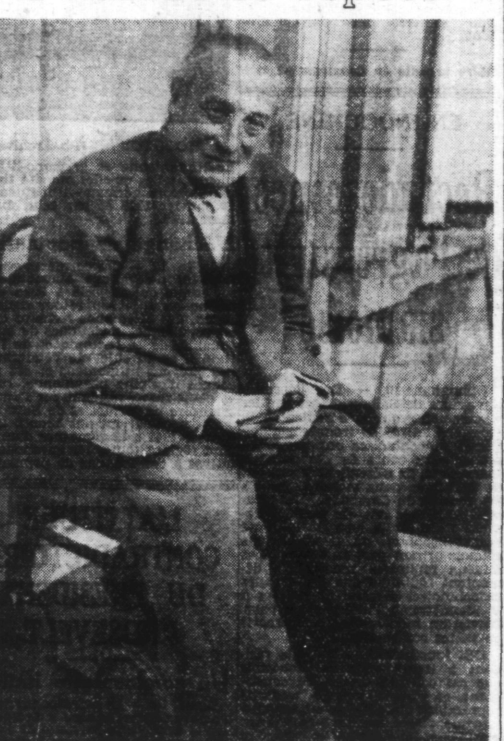
Le célèbre dessinateur des enfants, POULBOT, est souffrant depuis cinq ans. Le toci photographié dans sa propriété de COULBOY, près de CAEN, où il prend un peu de repos.