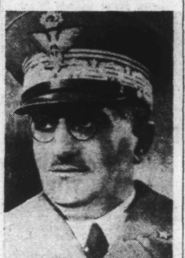
Le général Ugo CAVALLERO

Le Chef d'Etat-Major général de l'Armée italienne, le général Ugo Cavallero, vient d'être nommé commandant du groupe d'armée en Albanie, en remplacement du général Soddu qui avait demandé à être relevé de ses fonctions.