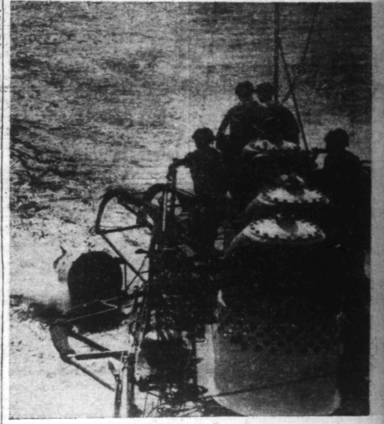
Un bâtiment italien procède à la pose de mines flottantes.