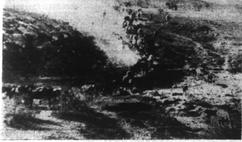
Une vue de l'immense région désertique du Middle West américain en période de sécheresse ; on voit un troupeau émigrant vers une région plus hospitalière. (Ph. Archives)

Le Chef d'Etat-Major général de l'Armée italienne, le général Ugo Cavallero, vient d'être nommé commandant du groupe d'armée en Albanie, en remplacement du général Soddu qui avait demandé à être relevé de ses fonctions.