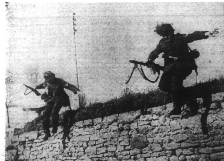
Les troupes allemandes sont soumises à un entraînement constant. D'un saut, on franchit le mur et le fusil mitrailleur ne tardera pas à être mis en batterie.