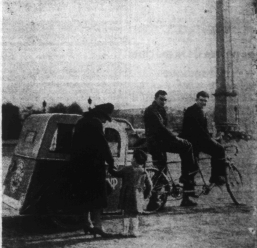
Sur la place de la Concorde, à PARIS, une jeune maman va prendre place avec son enfant dans un véhicule d'entière actualité.