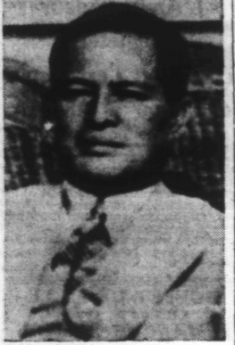
Le Général OSHIMA

M. von Ribbentrop assistait à l'entretien