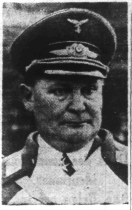
Le Maréchal GOERING

« Le peuple allemand est fier de vous et a confiance en votre valeur », a-t-il dit notamment