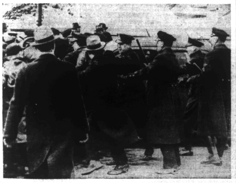
Polioemen aux prises avec des grévistes d'une grande aciérie de BUFFALO, dans l'Etat de New-York.