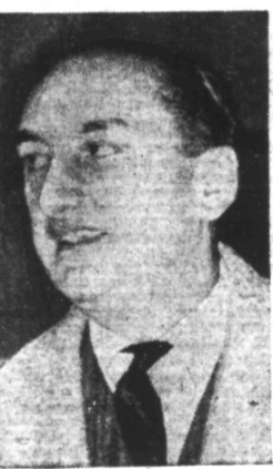
M. DE BRINON

Paris, 10. — Au cours d'un discours prononcé au Sénat le 6 mai, le sénateur démocrate Pepper a déclaré qu'il était temps pour les