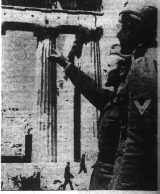
...les soldats allemands visitent les monuments historiques dont la capitale de la GRECE est si riche.