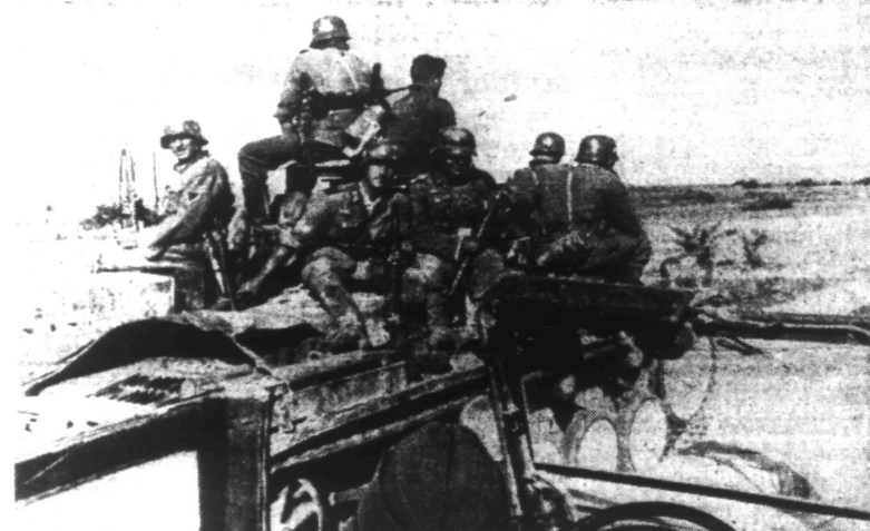
Un char blindé allemand emprunte la route pour se rendre à sa position de combat.

Berlin, 14. — L'agence D.N.B. apprend les détails suivants au sujet d'un communiqué militaire de ce jour : Depuis plusieurs semaines des combats sont en cours dans la région de Soloum et autour de la forteresse de Tobrouk ; ils attirent une nouvelle fois, d'une manière spéciale, l'attention sur le théâtre africain des opérations. D'importantes forces anglaises sont enfermées dans la forteresse de Tobrouk.