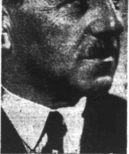
M. Jean BOROTRA