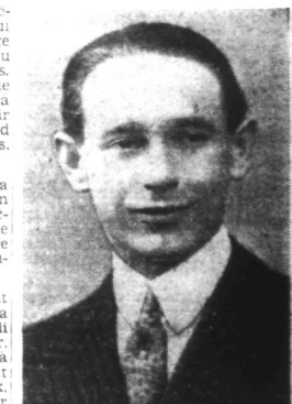
M. Jean BOROTRA

M. Jean Borotra, commissaire général à l'E.P. et aux Sports qui vient de rentrer d'un grand voyage de propagande sportive en Afrique du Nord, a des sports arrivés à Paris hier mercredi, informe lui-même les Services régionaux du C.G. à Lille, qu'il compte toujours pouvoir effectuer son voyage dans le nord de la France aux dates retenues, sauf imprévu.