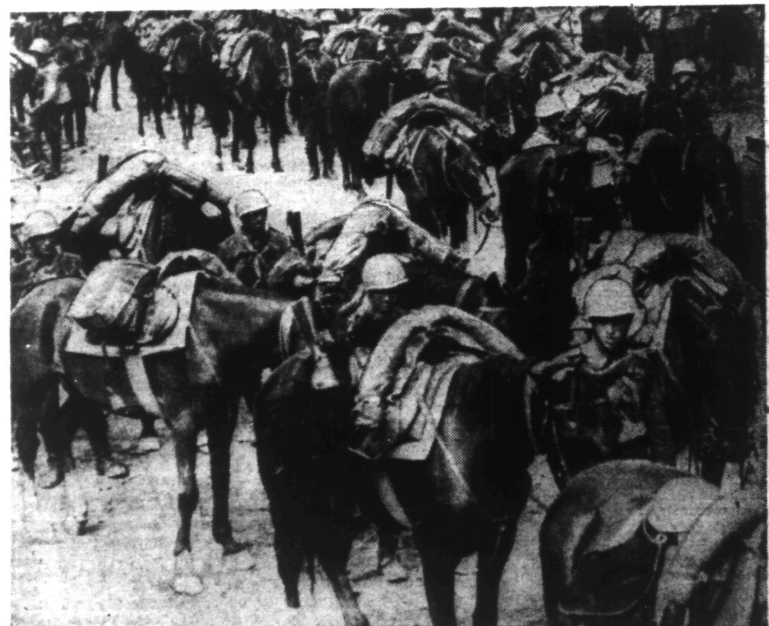
Un élément de cavalerie italienne en ABYSSINIE.

Faisant le point de la situation militaire en Afrique Orientale, la « Brüsseler Zeitung » écrit : Une armée britannique multicolore La guerre, en Afrique orientale, se déroule autrement qu'en Afrique du Nord. Les combats n'étant pas encore terminés, on peut beaucoup moins les juger. Les troupes, très supérieures en nombre, sous le commandement des généraux Platt et Cunningham, qui sont opposées aux Italiens, sont encore plus mélangées que celles de l'Empire en Afrique du Nord, car à côté des Anglais, des Australiens, des Français de De Gaulle et des Hindous, combattent encore, en Abyssinie, des Belges du Congo, des Écossais, des Sud-Africains et des rebelles abyssins qui ont reçu des Anglais, le nom bien sonnant de « patriotes ».