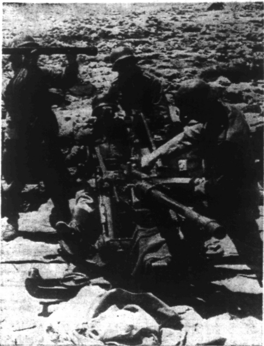
Une pièce antichars est prête à tirer.