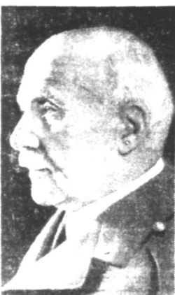
MARÉCHAL PÉTAÏN

Vous avez appris que l'amiral Darlan a eu tout récemment un entretien avec M. Hitler, chancelier du Reich. En principe, j'ai accueilli avec sympathie cette rencontre qui nous permet de voir clair dans l'avenir et de poursuivre avec le gouvernement du Reich les négociations en cours.