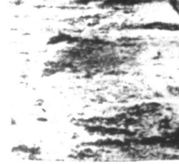
Chars allemands prêts à combattre dans la région de TOBROUCK.

Les prisonniers, pères ou fils de famille de 4 enfants mineurs, seront également libérés.