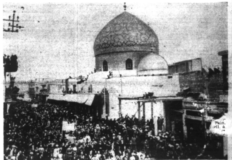
Dans tout l'IRAK règne une grande effervescence antianglaise. Notre photo montre une foule de manifestants formant un imposant cortège dans les rues de BAGDAD.

Damas, 31. — Voici le texte du communiqué irakien N° 33 :