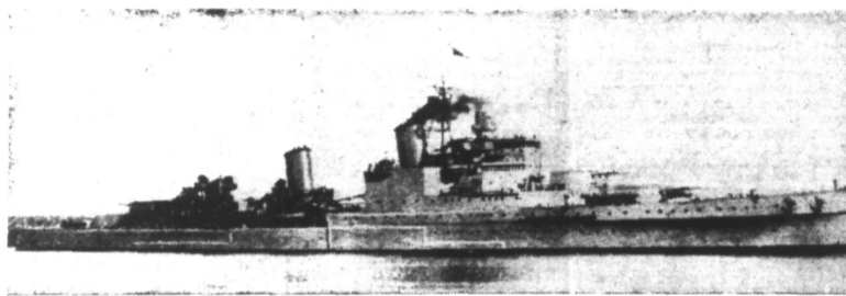
Le croiseur britannique « GLOUCESTER », détruit au cours de la bataille navale qui a précédé l'occupation de l'île de CRÈTE.

Berlin, 30. — Selon les plus récentes informations parvenues à l'agence D. N. B., la lutte en Crète est virtuellement terminée. Plusieurs milliers de prisonniers anglais et grecs ont été faits. D'autre part, une grande quantité de canons de lourd et de léger calibre, des chars blindés, des véhicules automobiles et du matériel de guerre sont tombés entre les mains des Allemands. Le 27 et le 28 mai, l'opéra défense des formations anglaises et grecques a été brisée par les troupes du Reich. Le 29 mai, les Allemands ont, malgré une chaleur tropicale et les difficultés du terrain, inlassablement pourchassé l'ennemi en déroute.