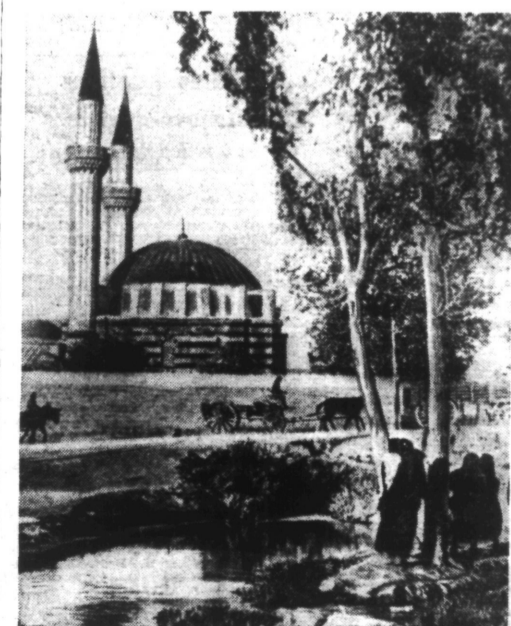
Une rue à DAMAS.

Vichy, 30. — Le gouvernement, réuni sous la présidence du maréchal Pétain, a pris d'importantes décisions concernant les salaires qui seront modifiés à partir du 1 er juin. M. Bouthillier, ministre des Finances, dans une déclaration à la presse, a indiqué le motif et l'importance de ces décisions. On sait que depuis la guerre les classes moyenne et ouvrière ont été atteintes considérablement. En effet, d'une part, les salaires ont été bloqués, d'autre part, et ce en raison des circonstances — il était impossible de les augmenter. D'autre part, malgré le blocage correspondant des prix et un contrôle rigoureux, il a été totalement impossible d'enrayer une hausse des produits non taxés due à une pénurie de denrées. Suite en 4 e page.