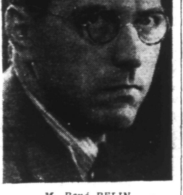
M. René BELIN