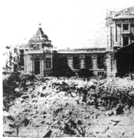
Le Quartier Universitaire de MADRID complètement détruit et que les Espagnols veulent laisser tel quel comme souvenir éternel des suites de la désunion.

Comment se présente la situation dans le pays espagnol. Les premières maisons sont en ruine. La ville frontière espagnole, est atteinte. Mais ce n'est pas la petite ville calme, au milieu des versants montagneux qui m'accueille.