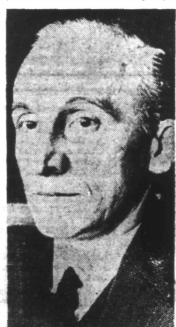
M. VON BARDOSSY