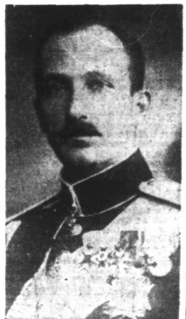
Le roi BORIS de BULGARIE.

Obersalzberg, 7. — Le Fuehrer a reçu la visite du Roi Boris de Bulgarie. M. von Ribbentrop a assisté à l'entretien.