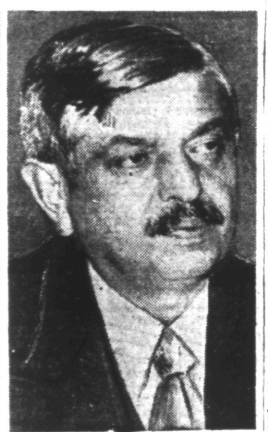
M. Pierre LAVAL.

On annonce de source bien informée que M. Pierre Laval qui, depuis sa retraite du Gouvernement le 13 Décembre 1940, séjourne à Paris, est attendu dimanche à Vichy. M. Laval fera une cure de repos dans sa propriété de Chateaudon, près de Vichy.