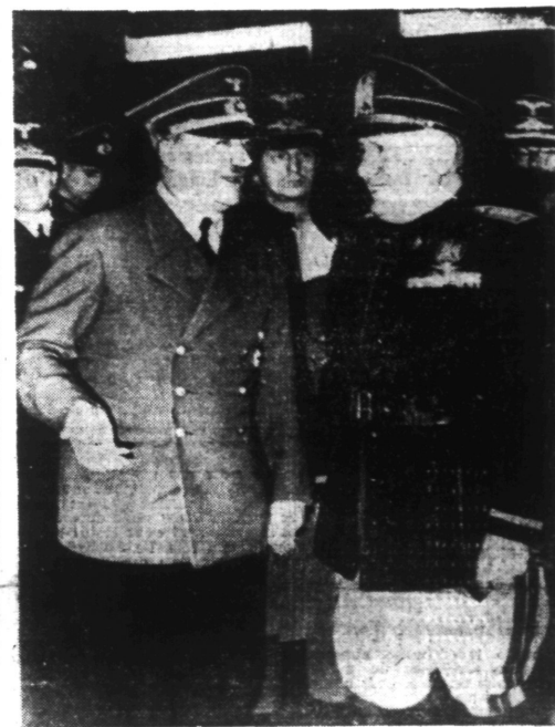
HITLER et MUSSOLINI, au cours de leur récente entrevue au BRENNER.

A ces mots, le Fuehrer n'a pu s'empêcher de s'esclaffer et il a déclaré que l'idée d'une invasion de l'hémisphère occidental était tout aussi fantaisiste que celle d'une attaque dirigée contre la lune. Il garde en trop haute estime le bon sens américain pour croire qu'un Américain réfléchit pourrait craindre réellement une pareille éventualité. Il est fermement persuadé que l'histoire de l'invasion a été lancée par des fauteurs de guerre contre leur propre conviction, parce qu'ils voyaient dans la guerre une source de profits. Les chefs de l'armée et de la flotte américaines doivent estimer certainement, tout comme les experts militaires allemands, qu'une pareille invasion