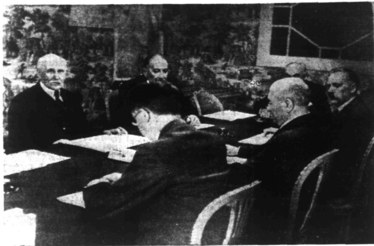
A VICHY, un récent Conseil des Ministres, à pris d'importantes décisions concernant la défense de l'Empire colonial français.

a déclaré M. Henri Haye Washington, 7. — Au cours d'une conférence de presse, M. Henri