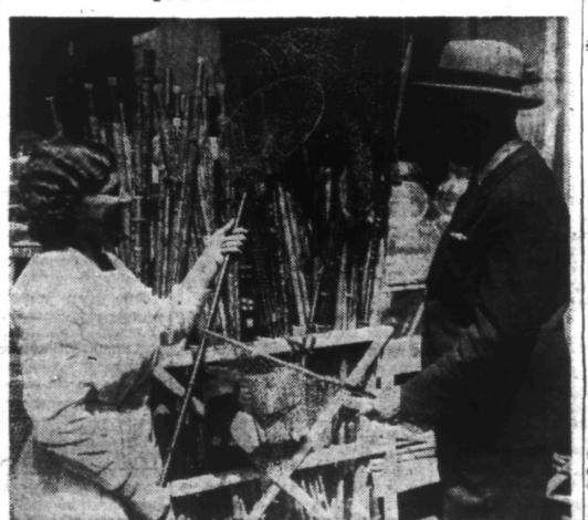
Pêcheur choisissant ses engins. (Ph. Archives).

C'EST VRAISEMBLABLEMENT DIMANCHE 15 JUIN QUE S'OUVRIRA LA SAISON