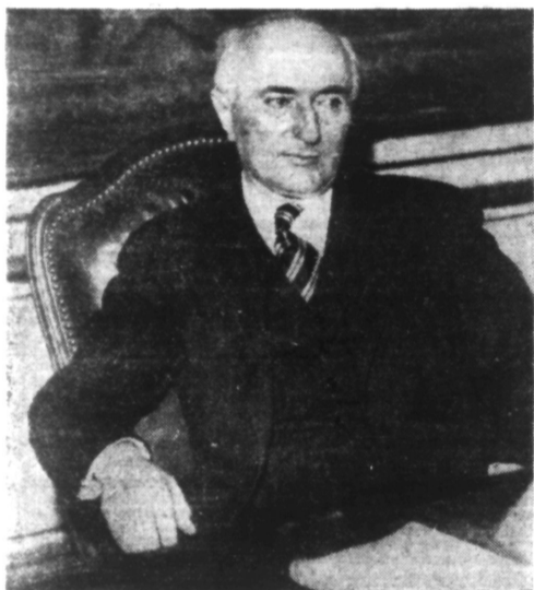
L'Amiral DARLAN

« SI LA NATION NE VEUT PAS COMPRENDRE, ELLE PÉRIRA », a précisé le Chef du Gouvernement français.