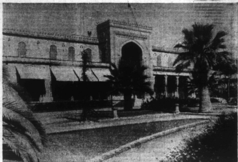
Une vue du Palais du Haut Commissaire des Etats du Levant sous mandat français, résidence du Général DENTZ.