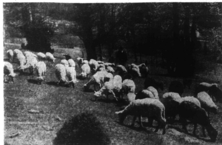
Une vue de la campagne aux environs de CRACOVIE.

« Pour le développement de l'Agriculture... Le Reich Grand Allemand, à qui est échue, comme grande tâche politique, la direction de l'espace économique européen, ne peut pas... »