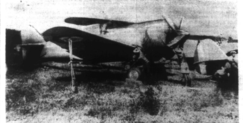
Pour répondre à l'agression anglaise en SYRIE, l'Aviation française s'est remise au travail. Voici une escadrille de la Marine mettant ses appareils au point.