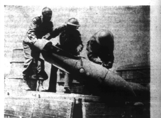
Prisonniers anglais au travail.