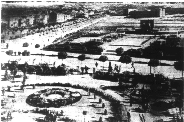
Une rue d'ANKARA, Capitale de la TURQUIE.

La conclusion de cet accord est une victoire décisive remportée sur une politique qui tendait à rendre la Turquie vassale des intérêts britanniques.