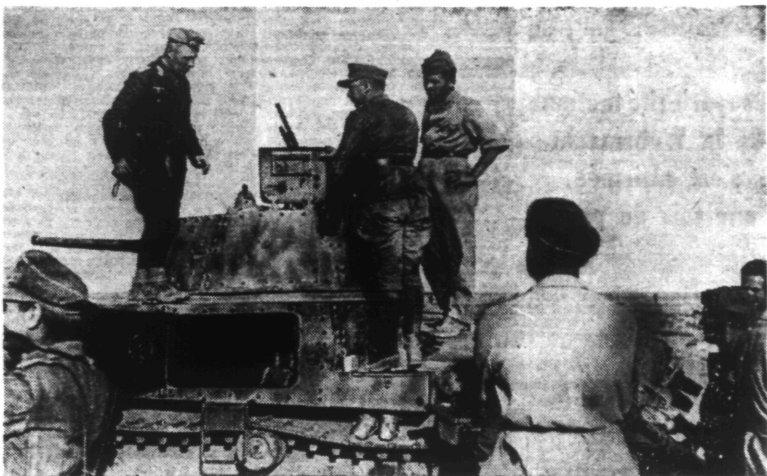
Le Général ROMMEL sur le front africain.

Vichy, 18. — Le gouvernement vient de retirer la nationalité française à 37 Français. Cette mesure a été prise à l'égard de 7 juifs parce qu'ils ont quitté la France entre le 10 mai et le 30 juin, sans raison ni instructions spéciales. Les autres 30 personnes ont été déclarées déchues de la nationalité française pour s'être mises au service de la propagande anglaise et gaulliste et être intervenues activement en faveur des intérêts de l'Angleterre. Parmi elles se trouvent une série d'anciens diplomates français ainsi que plusieurs fonctionnaires coloniaux français.