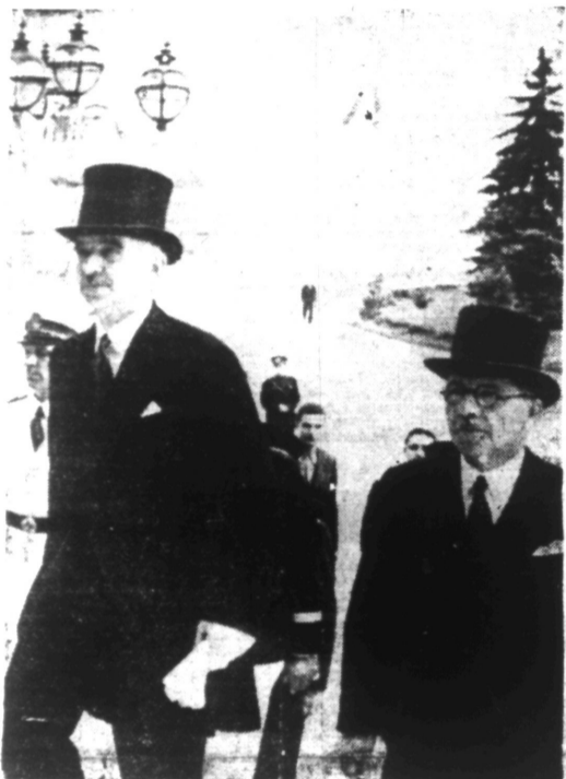
Le Président İSMET İNONU et M. Sue Karue SARADJOGLOU, Ministre des Affaires étrangères de la Turquie, arrivant au Parlement d'ANKARA.

A Berlin et à Rome, ce nouveau succès des puissances de l'Axe a été enregistré avec une vive satisfaction