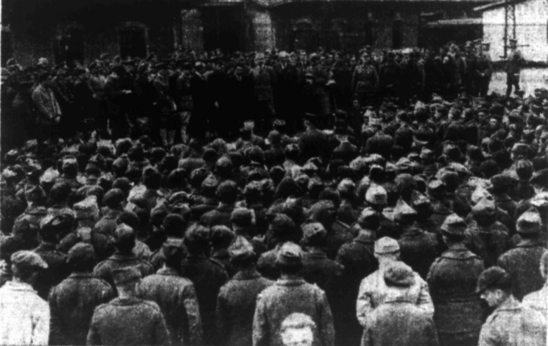
Le retour massif des prisonniers est commencé. Voici les occupants d'un premier train de péres de quatre enfants ou fils aimés de quatre enfants libérés, qui est arrivé en gare de Chalons-sur-Saône, écoutant M. SCAPINI, ambassadeur de France, qui leur souhaite la bienvenue.