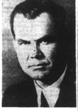
M. WRANGELL, Premier ministre Finlandais.

La réaction mondiale devant le conflit germano-soviétique POUR SA PART, LA HONGRIE A ROMPU DIPLOMATIQUEMENT AVEC MOSCOU LIRE NOS INFORMATIONS EN QUATRIEME PAGE (Lire la suite en deuxième page)