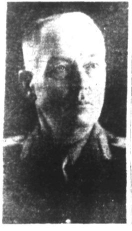
Le général ANTONESCU

La décision du Führer a causé dans le monde entier une émotion considérable Dans la plupart des Pays, on souligne que, seule, l'intervention de l'Allemagne en U. R. S. S. est capable de sauver l'Europe des horreurs du bolchevisme