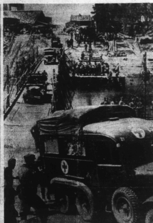
A côté des ponts détruits par l'armée soviétique en retraite, les pionniers allemands construisent des ponts de secours pour le passage des colonnes motorisées.

Dans les différents secteurs, nous avons fait, au cours de ces deux derniers jours, quarante prisonniers dont un colonel anglais.