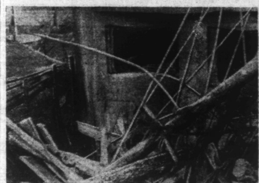
Ce qui reste d'un fort soviétique après les durs combats livrés par l'armée allemande. (Ph. Sado).

Heisinki, 29. — Le maréchal Mannerheim a adressé ce matin, de son quartier général, l'ordre du jour suivant aux soldats finlandais : « Notre campagne d'hiver se termina par une paix amère. Malgré cette paix, notre pays a été sans cesse l'objet de menaces accélérées et de continuelles extorsions de l'ennemi, qui n'a jamais voulu de paix durable ; celle qui fut conclue n'a été qu'un armistice aujourd'hui terminé. »