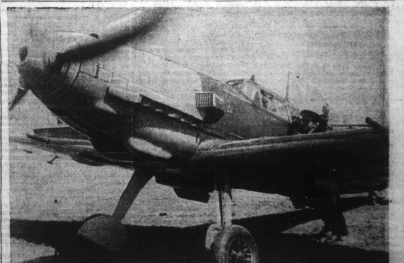
L'Officier de service donne les derniers renseignements au pilote roumain d'un Messerschmitt de chasse.

Paris, 30. — Hier après-midi, à visibilité parfaite, aucune erreur n'était possible. Quinze bombes, accompagnées de sept chasseurs, ont été lancées : deux seurs, ont bombardé la résidence privée du Haut-Commissaire de France à Beyrouth, causant cinq morts et quatre blessés parmi les hommes de garde et le personnel. Elle est éloignée de tout objectif militaire. Les bombardiers britanniques volaient très bas, leur