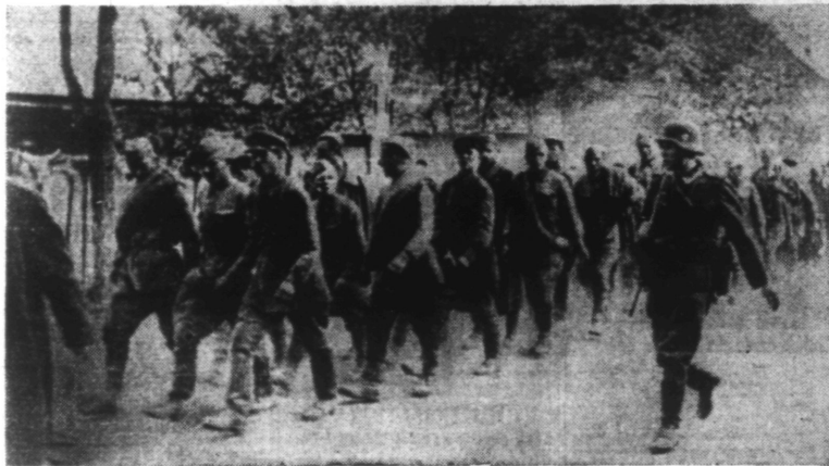
Prisonniers soviétiques en route vers les camps.

Le Haut Commandement allemand annonce par radio spécial que la ville de Lemberg a été prise. Le drapeau Allemand flotte sur la citadelle depuis 4 h. 20, ce matin.