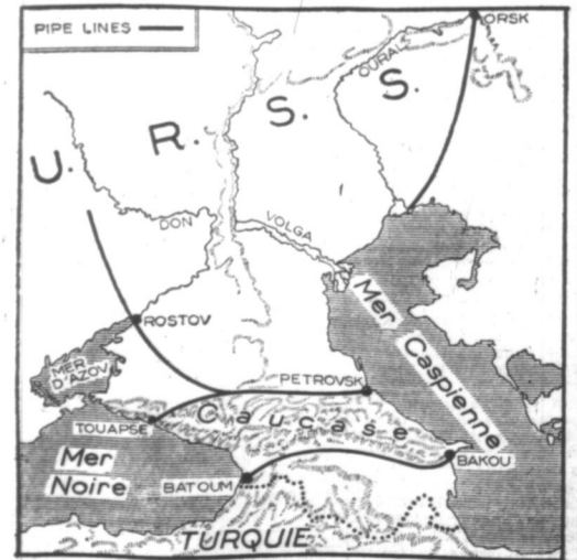
Les réserves pétrolières de l'U.R.S.S. entre la mer Noire et la mer Caspienne.

Elles offrent des perspectives extraordinaires pour l'avenir