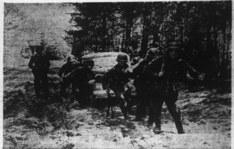
Les difficultés de terrain sont énormes, mais les soldats interviennent énergiquement pour débarrasser les véhicules.