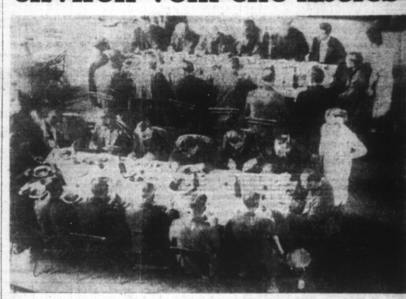
A leur arrivée à CHALONS-SUR-MARNE, les prisonniers libérés prennent un repas avant de poursuivre leur voyage de retour au foyer.

Paris 4. — M. Scapini a obtenu, environ 100.000 hommes, dans les territoires occupés, compte tenu des anciens combattants de 1914-18, dont le rattachement des leurs était décidé.