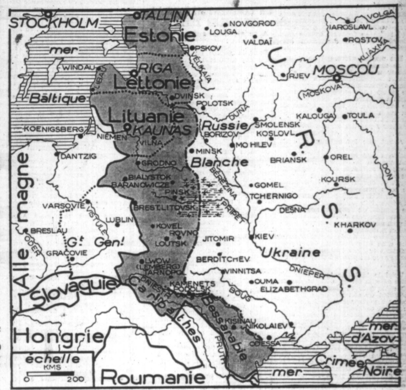
légende: TERRITOIRES OCCUPES PAR L'URSS DEPUIS 1939

Vichy, 5. — Le maréchal Pétain vient de signer une loi créant en faveur des industriels et commerçants particulièrement sinistrés par des faits de guerre, un régime provisoire d'avances. Il appartenait au Secrétaire d'Etat à la Production industrielle de commenter cette loi. M. Pierre Pucheu, actuellement à Paris en un donc souligne toute l'utilité. Si les circonstances interdisent tous les travaux de reconstruction de trop grande ampleur, du moins le gouvernement fait-il tout le possible pour réparer immeubles et outillages et pour reconstituer les stocks.