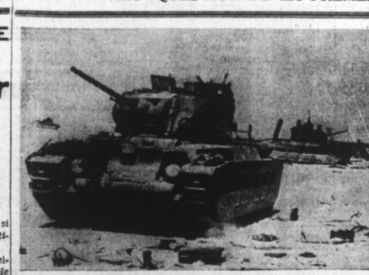
Quelques-uns des 200 chars d'assaut, qui ont été anéantis par le Corps allemand d'Afrique, pendant la grande bataille, qui s'est déroulée à MARMARICA, devant SOLLOUM, le 19 juin 1941.

LE JURY DES ASSISES DU BRABANT A ÉCARTÉ LA QUESTION DE LA PRÉMÉDITATION