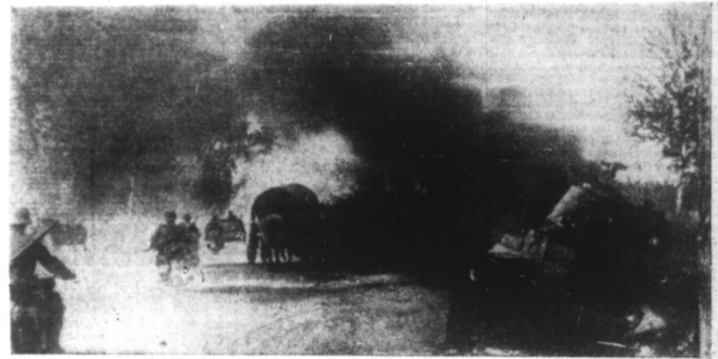
Les troupes du Reich ont anéanti une contre-attaque russe. Des chars d'assaut russes gisent en flammes le long des routes tandis que les troupes progressent.