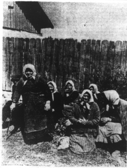
Types de paysans russes.