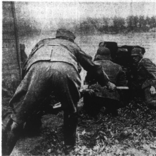
Soldats allemands au cours d'un combat sur le front Est.