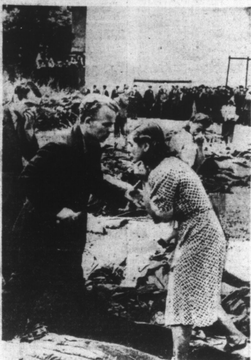
En entrant à LEMBERG, les troupes allemandes ont découvert dans les prisons 3.000 cadavres de victimes de la G.P.U. Des scènes déchirantes se sont produites parmi la population appelée à reconnaître les cadavres.