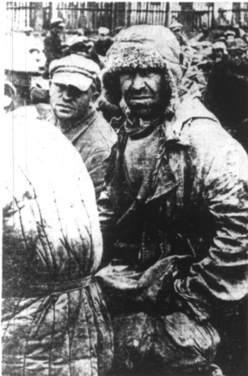
Parmi les bolchevistes faits prisonniers par l'armée allemande, se trouvent des représentants de toutes les races. (Ph. Siphon).

Poursuivant leur avance en Esthonie les forces du Reich occupent Ostrov, Fellin et Pernau