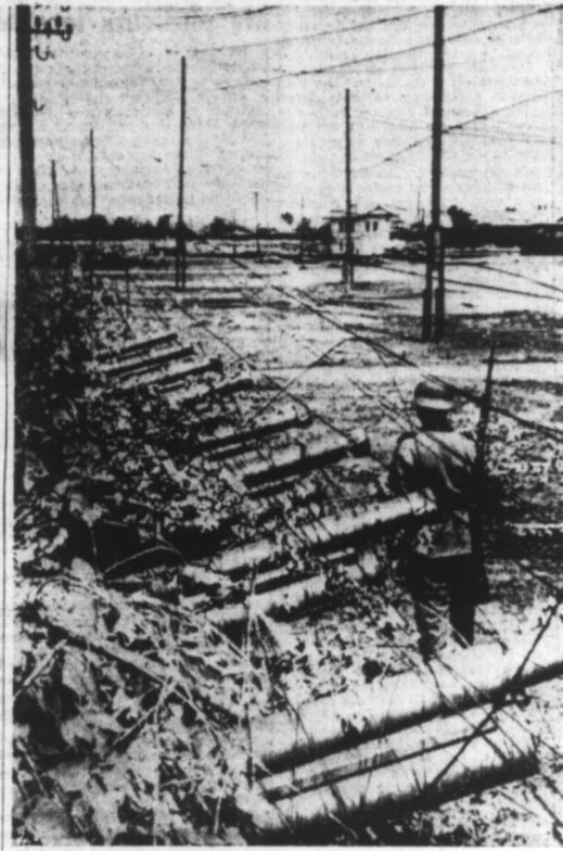
En pénétrant en Russie, les troupes allemandes découvrirent de nombreuses batteries destinées à la guerre... en Allemagne. Les troupes du Reich se les approprièrent et les rendirent ainsi inoffensives. (Ph. Graphopresse).

Des jeunes filles ont lancé des baisers aux représentants militaires de l'U. R. S. S. On a acclamé l'armée soviétique ainsi que l'alliance entre l'Union soviétique et la Grande-Bretagne.