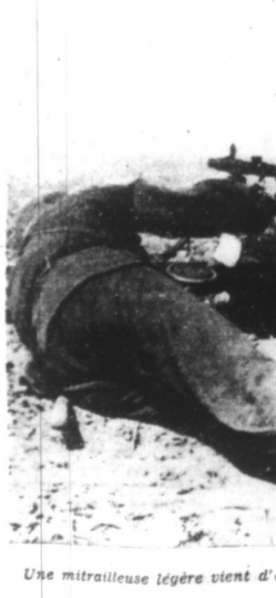
Une mitrailleuse légère vient d'être mise en batterie. Le tir commence contre les lignes ennemies. (Ph. Graphopresse).

Vichy, 9. — Le Journal Officiel de ce jour publie à nouveau les noms de 119 personnes qui ont été déchues de la nationalité française. Il s'agit en ordre principal de juifs communistes de l'Union Soviétique et de la Pologne qui avaient immigré et s'y étaient fait naturaliser. Ainsi au cours de ces trois dernières journées, au total environ 500 personnes ont été déclarées déchues de la nationalité française.