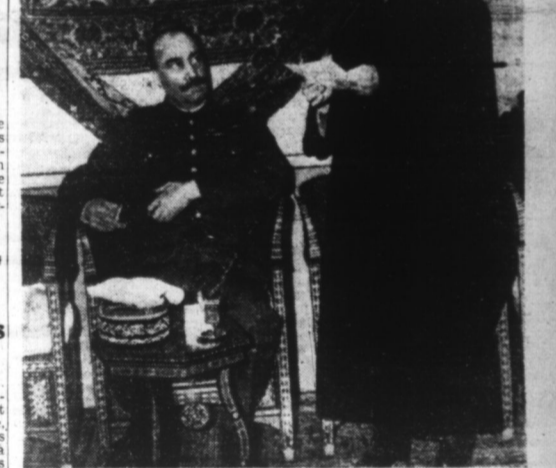
Le général DENTZ, Haut-Commissaire de France en Syrie, écoutant une déclaration de loyauté et de fidélité envers la France.

SI LES CONDITIONS D'ARMISTICE ÉTAIENT TROP DURES LA LUTTE CONTINUERAIT... Vichy, 10. — On confirme dans les milieux autorisés que le général Dentz a demandé la cessation des hostilités en Syrie. Cette décision a été prise en raison du manque de ravitaillement et de munitions, ainsi que du nombre de plus en plus disproportionné des troupes