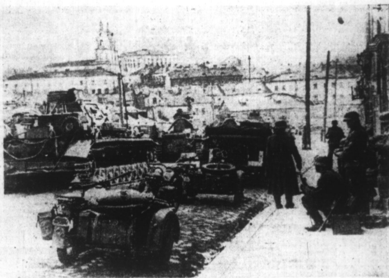
Troupes allemandes s'installant à MINSK, après leur entrée dans la capitale de la Russie Blanche.

PRÈS DU CANAL DE SUEZ L'aviation du Reich a détruit au sol plus de 100 appareils britanniques