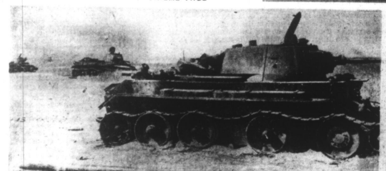
Après le choc d'éléments blindés, le terrain est jonché de chars soviétiques détruits ou abandonnés. (Ph. Graphopresse).