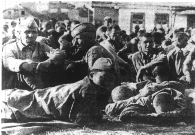
Un groupe de prisonniers soviétiques rassemblés sur une place.

400.000 prisonniers. 7615 chars blindés. 4423 canons. 6233 avions.