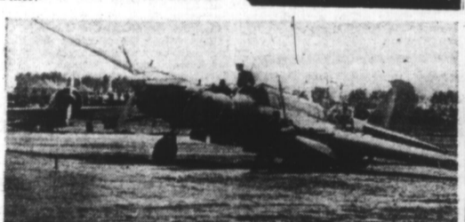
Appareils ennemis détruits au sol, en Lithuanie, par l'aviation allemande.

Berlin, 10. — D'après les informations dont on dispose jusqu'à l'heure actuelle, cent et dix avions soviétiques ont été détruits sur le front Est au cours de la journée d'hier.