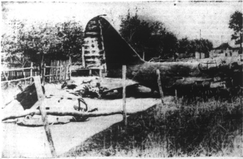
BOMBARDIER SOVIÉTIQUE ECRASÉ AU SOL.

DÈS LES PREMIERS JOURS DE LA GUERRE ELLE A SUBI DES PERTES ÉNORMES (LIRE L'ARTICLE EN QUATRIÈME PAGE)