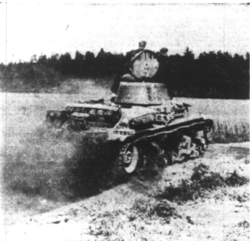
Tank allemand en action sur le front oriental.

Les pertes bolchevistes s'élèveraient à un million d'hommes