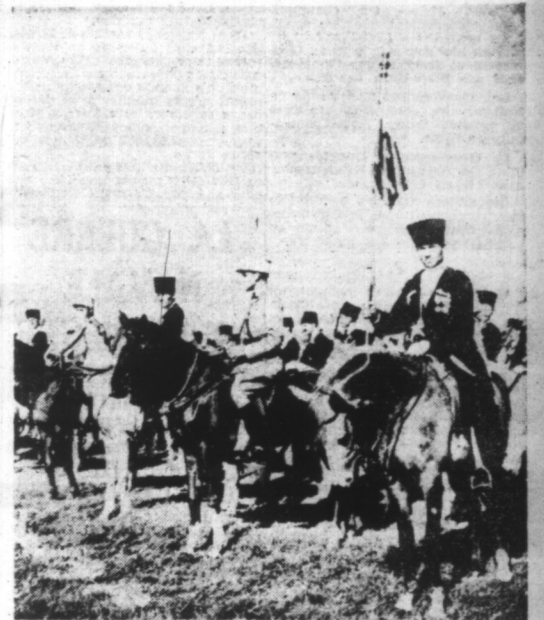
Un escadron de cavalerie Scherkes faisant partie des forces françaises de SYRIE.