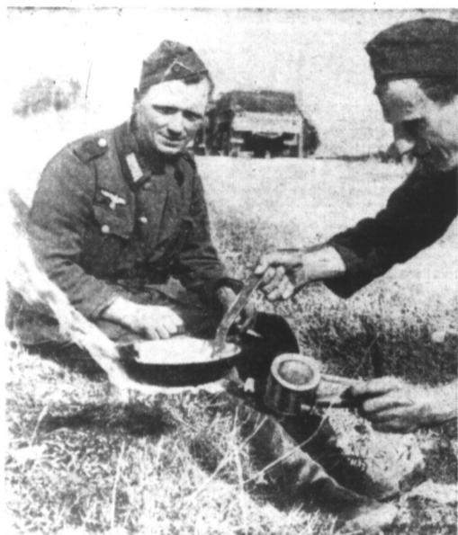
Pour leur déjeuner, pendant une halte sur le front de l'Est, des soldats se font cuire une succulente omelette.

Par la prise de la ligne Staline la dernière construction fortifiée sur le continent européen est liquidée