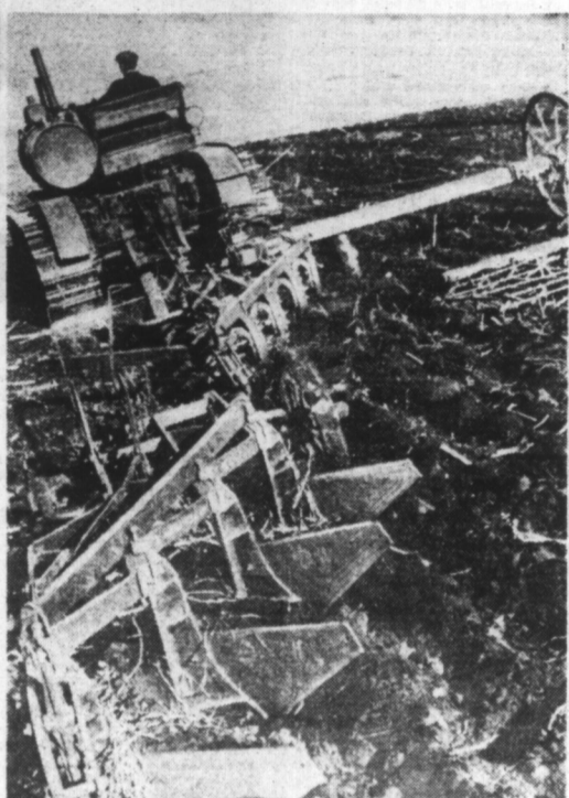
Les travaux de labour des célèbres « terres noires » de l'UKRAINE.