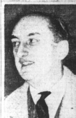
M. DE BRINON

Paris, 14. — M. l'ambassadeur de Brinon, mandataire du gouvernement français dans les territoires occupés a fait des déclarations aux journalistes américains au sujet de la propagande des Anglais, des gaullistes et des communistes.