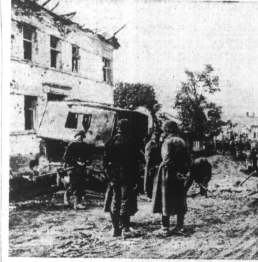
Après la fin du combat dans un village soviétique, les troupes allemandes occupent la grande rue avec leur matériel.

(LIRE EN DEUXIÈME PAGE LE COMMUNIQUÉ ITALIEN).