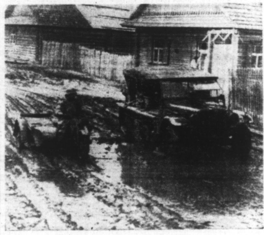
Dans leur avance, les troupes allemandes ne rencontrent pas de voies de communication en bon état. Il leur faut surmonter ces difficultés supplémentaires qui éprouvent la valeur de leur matériel.