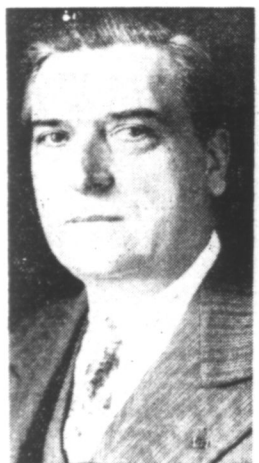
M. CAYLA, Gouverneur général de Madagascar

Vichy, 19. — A l'occasion de la Semaine de la France d'Outre-Mer, M. Cayla, gouverneur de Madagascar, a prononcé samedi soir, à la radio, l'allocution suivante :