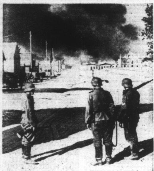
Au cours de leur retraite, les troupes soviétiques mettent le feu à tous les villages qu'ils ont occupés d'abandonner.

La fatalité amena cet homme ivre, à la hauteur d'une carriole qui ramenait dans la commune les pains du ravitaillement.